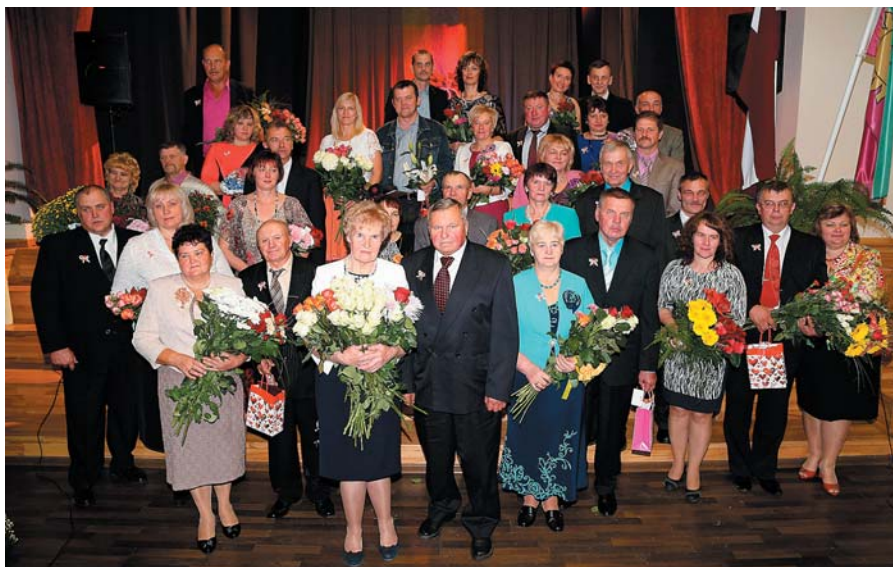
Stiprās ģimenes 2014.

Katrs pāris, pirms apliecības saņemšanas, aizdedzināja savas ģimenes sveci, apliecinot savas mīlestības spēku un gaišumu. Jēkabpils novada Stiprās