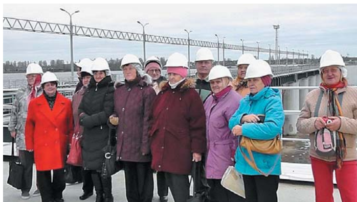
Kalna pagasta pensionāri.