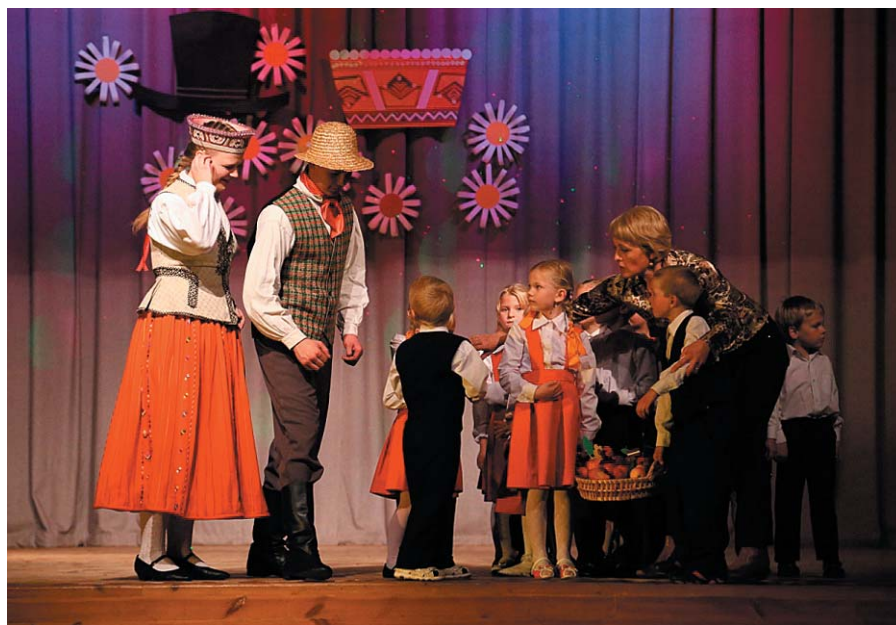
„Smaidiņi” sveic „Soli”.

jau soļojam 5 gadus! Augot un attīstoties, aug arī mūsu sapņi un mērķi.. Kā viens no sapņiem mums bija izveidot savu jubilejas koncertu un šā gada 10. oktobrī tas tika īstenots!