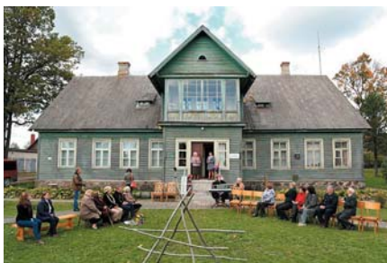
Meža muzejs „Liepas”.

verīte” auklīte – audzinātāja, kura daudziem bērniem visu nedēļu bija mammas vietā. Vai šie bērni šodien atcerās auklīti?... Un viņas mīlo roku glāstus?... Vai atcerās viņas nomierinošos vārdus? O. Bandere mīlēja bērnus. Bērnodārzā „Vāverīte” nostrādāja 22 gadus, izauklēja vairākas mežinieku paaudzes.