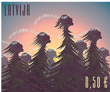
Pastmarka „Dziedošie koki”.

cinājuma, ka tas ir dziedošais latvietis, dziesmu svētki un daba. Dziesmu svētkos lielais kopkoris atgādina šalcošu mežu. Un atkal jādodomā, kā to sasaistīt?