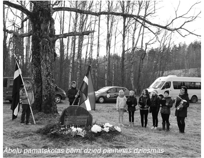
Abeļu pamatskolas bērni dzied pieminas dziesmas