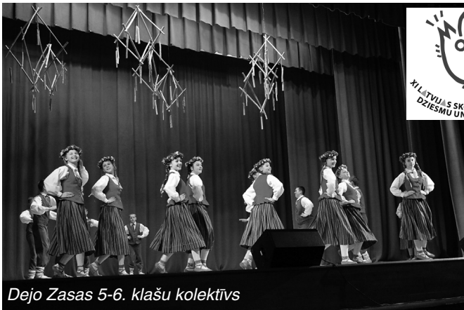
Dejo Zasas 5-6. klašu kolektīvs