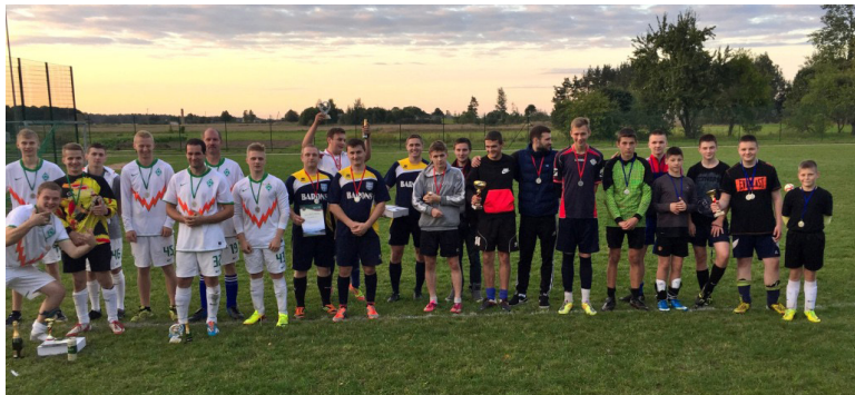
Turnīra apakšgrupas tabula: