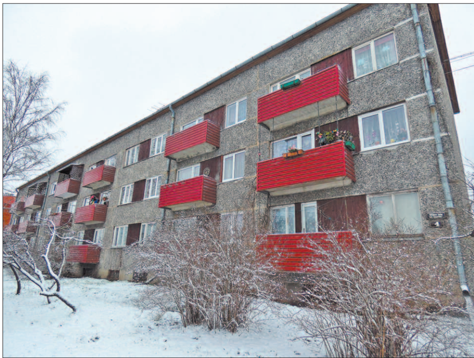
Vīlānu iela 4

D zīvokļa īpašuma likuma 4. pantā noteikts, ka balkoni un lodžijas ir kopīpašuma daļa, tādēļ tos pārbūvēt pēc saviem ieskatiem ir aizliegts, savukārt šī likuma 10. pants paredz, ka dzīvokļa īpašniekam ir pienākums saudzīgi izturēties pret kopīpašumā esošo daļu, ievērot tās lietošanas noteikumus, kā arī normatīvajos aktos noteiktās sanitārās, ugunsdrošības un citas prasības, lai neradītu aizskārumu citu cilvēku drošībai un veselībai, apkārtnes vides kvalitātei, un radzīties, lai šos noteikumus un prasības ievērotu personas, kas iemītnātas viņa dzīvokļa īpašumā.