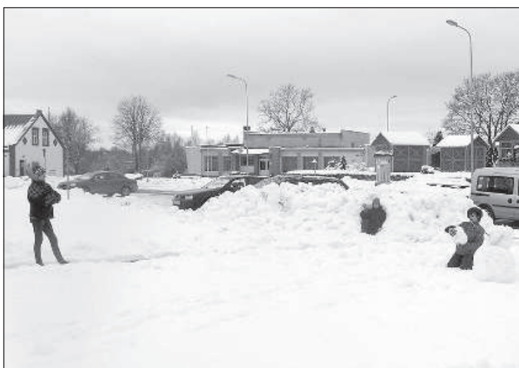
Рыночная площадь, зимние забавы — мальчики строят крепость.

когда сможем встретиться. Поездка в гости будет первое, что мы сделаем.