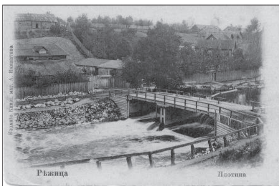
Лицевая сторона открытки царских времен.