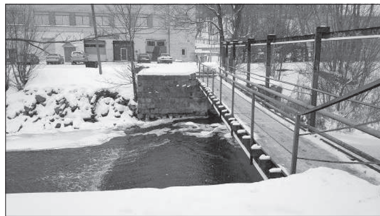
Река Резекне (2019 год).

Плотина, мост и мельница были построены на месте старых в 50-х годах 19-го века. Спланировал постройку ее владелец Елгавский бюргермейстер Густав Лещинский. 8 Используя силу реки Резекне, здесь молотило зерно, позже пилили бревна и производили электричество. Был также причал на правом берегу и специальный проток для плотов и лодок. В 1901 году здесь была установлена первая в Латгалии водная турбина. 9 Над плотинной был деревянный мост (его основательно перестроили в 1927 году), по которому ходили пешком и ездили в повозках. Лещинский эту гидро-инженерно-техническую постройку постоянно модерни-