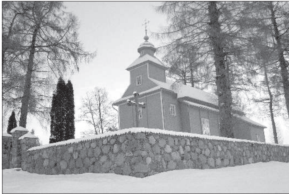
Костелу св. Иоанна Крестителя почти 400 лет.

Относился храм в те времена к Могилевской епархии и епископом Поппавским 7 сентября 1698 года был освящен под титулом Иоанна Крестителя. Таким образом храму по самым скромным подсчетам более трех сотен лет. Удивительно, что за эти столетия он прекрасно сохранился и нуждается лишь в текущих ремонтах и реставрациях. Поньше в нем молятся прихожане и посещают туристы.