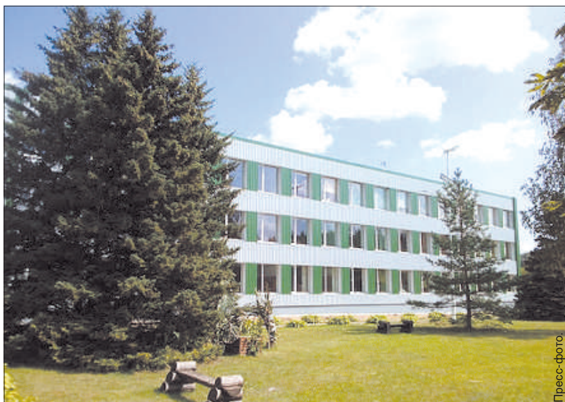
Риебиньская средняя школа.

Из-за распространения «Covid-19» учащиеся образовательных учреждений учатся удаленно. У 7-12 классов удаленное обучение продолжается с осенних каникул, у 5-6 классов – с 11 января, а учащиеся 1-4 классов начали удаленное обучение 25 января. Опыт удаленного обучения школы получили еще весной, но, несмотря на это, школам нужно думать, как организовать работу, одновременно позаботиться о здоровье учеников и учителей и об успешном обучении и результатах.