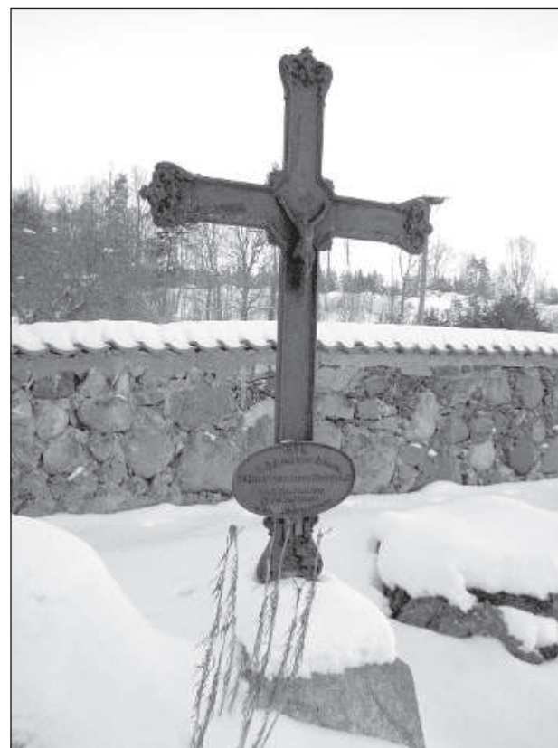
Некоторые священники погребены на территории храма.