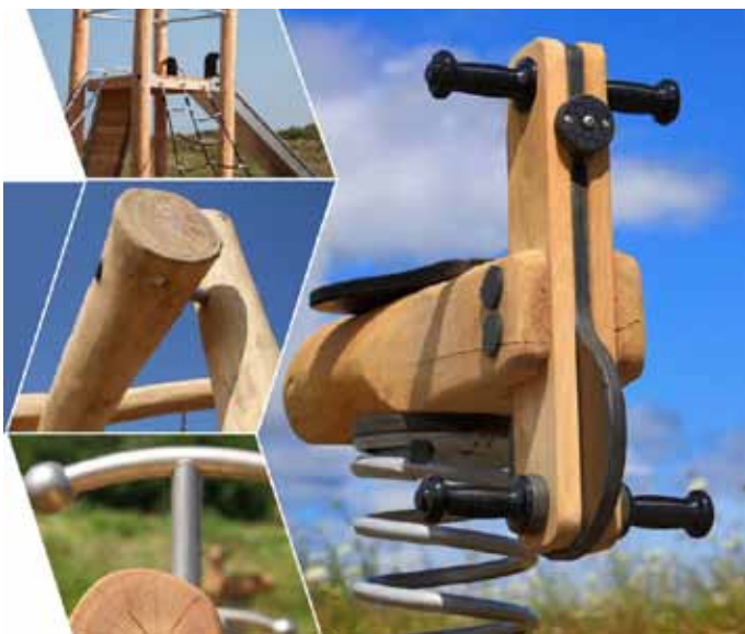
Iespējams uzstādīt arī sertificētus rotaļu elementus, kuros dominē koks.