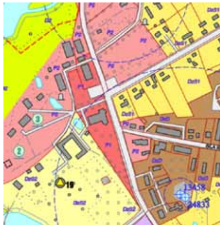
Izkopējums no Teritorijas plānojuma Grafiskās daļas: Zasas ciema teritorijas funkcionālais zonējums un apgrūtinātās teritorijas, objekti un to aizsargjoslas.

būves kārtību", Jēkabpils novada dome 2013. gada 22. augustā domes sēdē (lēmums Nr.288) apstiprināja saistošos noteikumus Nr.9/2013 „Par Jēkabpils novada teritorijas plānojuma 2013. - 2025. gadam Teritorijas izmantošanas un apbūves noteikumiem un Grafisko daļu”, kas stājušies spēkā un tiek īstenoti no 2013. gada 14. novembra (shematisks procesa attēlo-