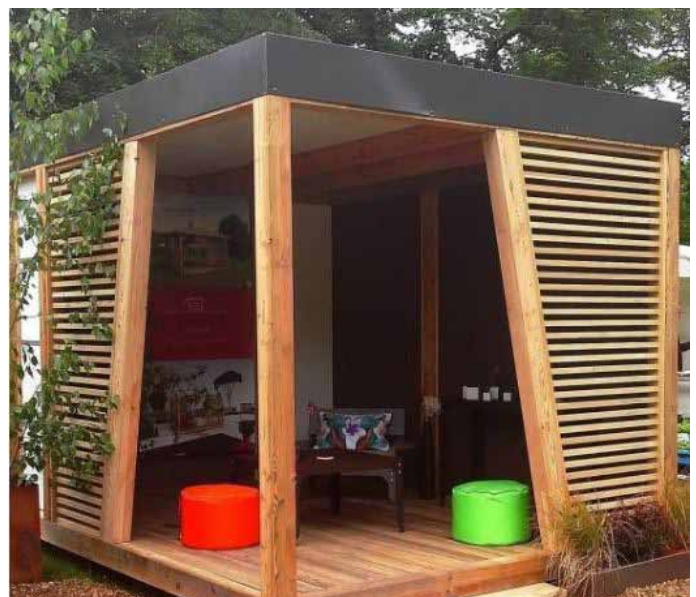
Iespējamais pirmsskolas grupiņu nojumes izskats