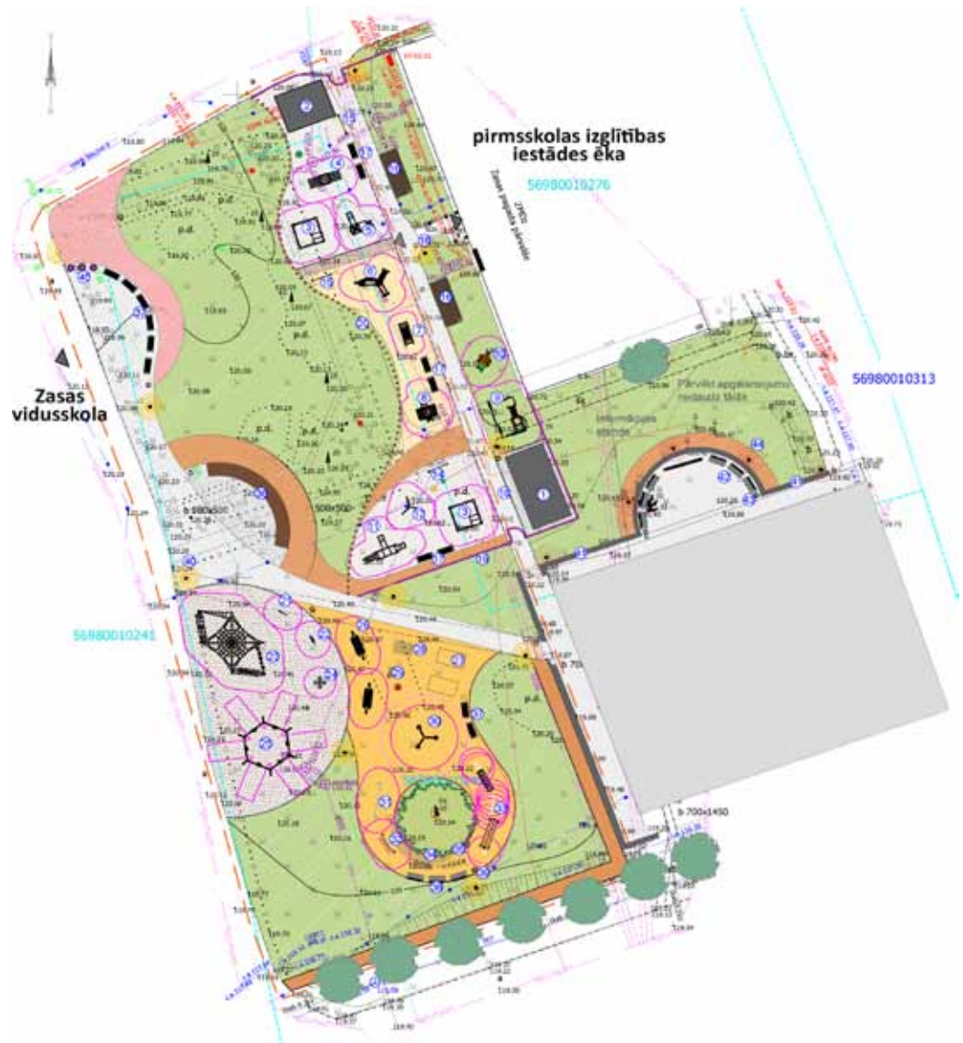
Jaunākā labiekārtojuma priekšlikuma versija (01.02.2021.), kas izveidota pēc notikušajām sarunām ar iedzīvotāju pārstāvjiem, pašvaldības un skolas darbiniekiem, deputātiem. Plašāks attēls pieejams novada mājaslapā.