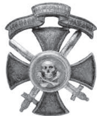
Нагрудный знак партизанского подразделения Глазенапа.

Лузнавское поместье невероятно красиво. Что-то подобно красивое в Латгалии есть в Преи-ли и в Рикаве, а в Восточной Селии – в Червонке и в Калкунах.