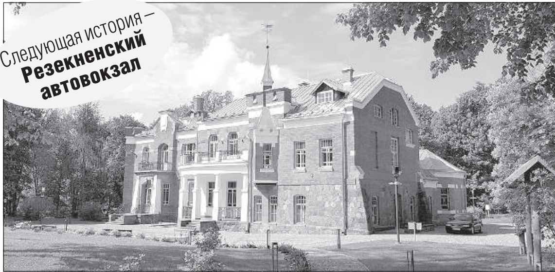
Лузнавское поместье, которое смело можно назвать дворцом.

Следующая история – Резекненский автовокзал