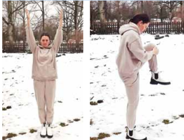
Ieelpā rokas tiek paceltas augšā.