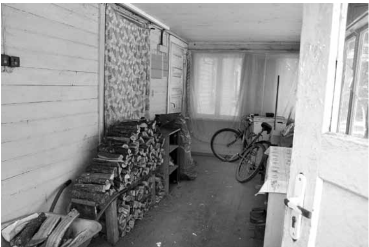
Sētas pusē viens dzīvoklis vēl apdzīvots, tā iemītniecei pensionārei malka sagādāta, taču kapitālais remonts vajadzīgs krāsniem tāpat kā visai mājai.