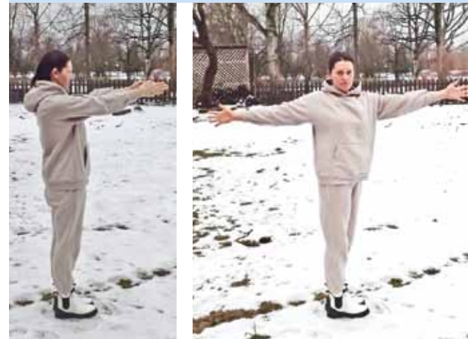
Ieelpā rokas tur priekšā.