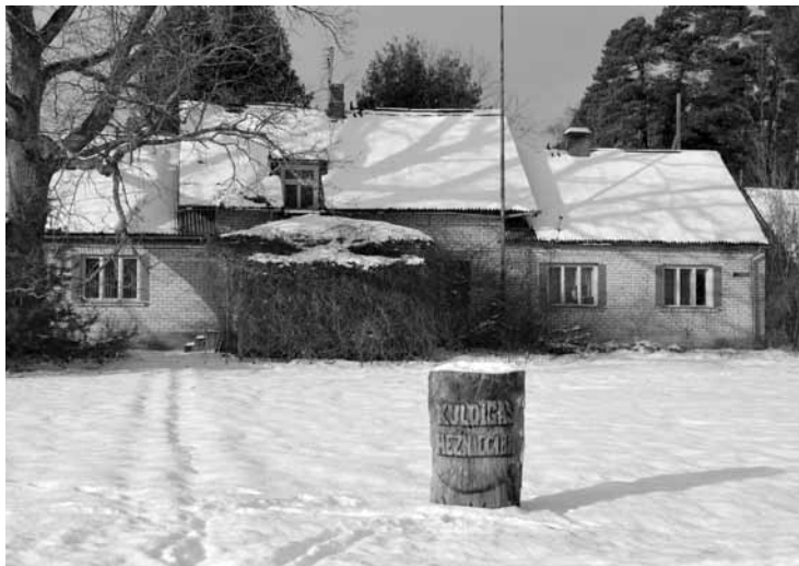
Čiekuriši Mežvaldē, kur no padomju mežsaimniecības gadiem līdz neatkarīgās Latvijas Valsts meža dienesta optimizācijai darbojusies Kuldīgas mežniecība, no attāluma nemaz tik slikti neizskatās, jo katastrofālā stāvoklī esošo jumtu klāj sniegs.

Remonta tāme Čiekurišiem ir tuvu 50 tūkstošiem eiro. „Māja vizuāli diezgan smuka, vieta arī laba, jo tuvu centram,” teic apsaimniekotāja, SIA Kuldīgas komunālie pa-