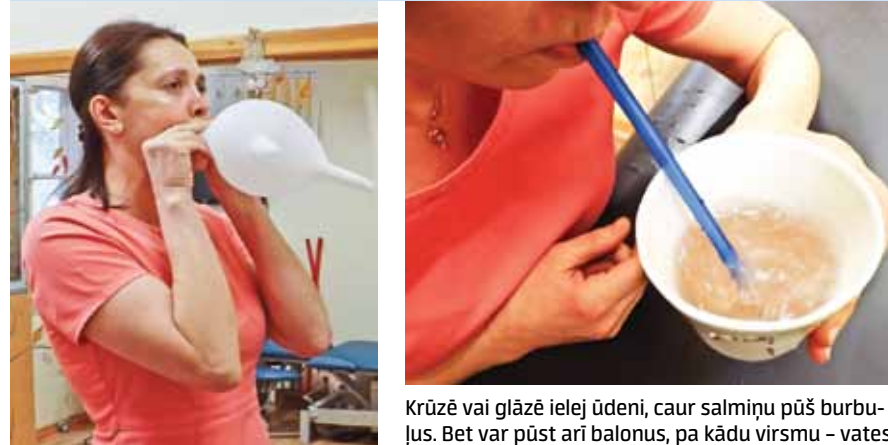
Elpošanu var vingrināt, piepūšot cimdus.