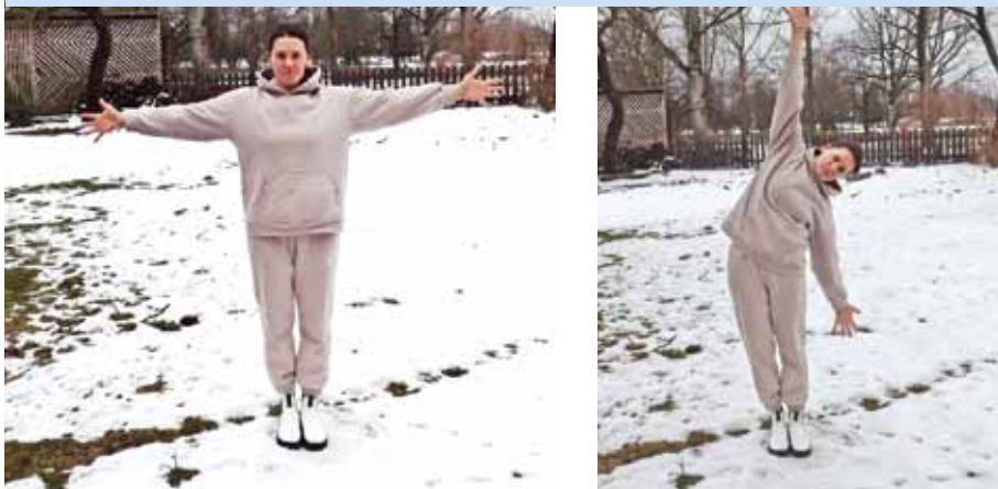
Ieelpojot rokas ir sānis.