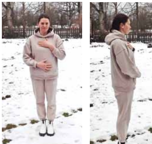
Ieelpā vēders izvirzās uz priekšu.