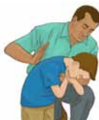
Paliec viņu nedaudz uz priekšu un piecreiz uzsit starp lāpstiņām virzienā uz galvu.