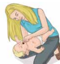
Pagriez zidaini otrādi un pārbauda, vai svešķermenis nav redzams.

Ja tas nav izkritis, bērnu noliek guļus ar skatu uz augšu, galviņa ir nedaudz zemāk. Ar diviem pirkstiem piecas reizes izdara straujus grūdienus krūškurvja vidū (nedaudz zem līnijas, kas savieno krūšu galus)