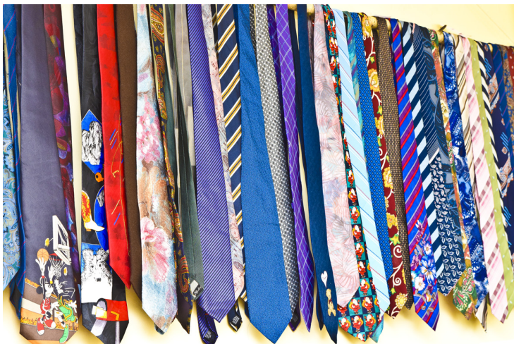
Raņķu bibliotēkā – 150 kaklasaites. Diemžēl nav zināmi stāsti, kā katra pie sava saimnieka nonākusi, kā kalpojusi un kamdēļ nokļuvusi Latvijā.