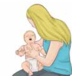
Jāpaskatās mutē, vai svešķermenis ir redzams; ja ir, tas jāizņem; ja ne, tad dara tālāko.