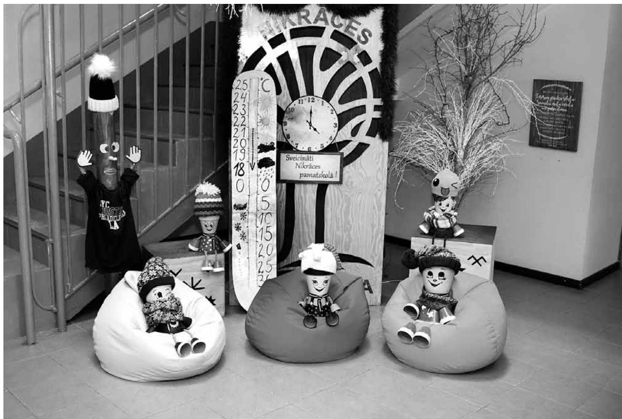
Nīkrāces pamatskolas vestibilā rūķi gaidīt gaida, kad ēkā atkal atgriezīsies bērnu čalas un smieklī. Vadība cer, ka šī mācību gada beigās tomēr izdosies visus skolēnus atkal satikt klātienē.