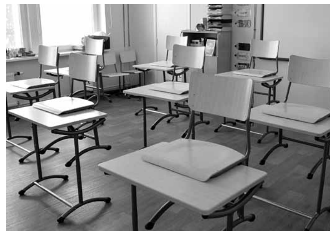
Problēmas ar sekmju līmeni var rasties tad, kad audzēkņi atgriezīsies skolā un visi uzdevumi atkal būs jāpilda pašiem. Tas tamdēļ, ka daudzi vecāki mājas darbus izpildot bērna vietā.