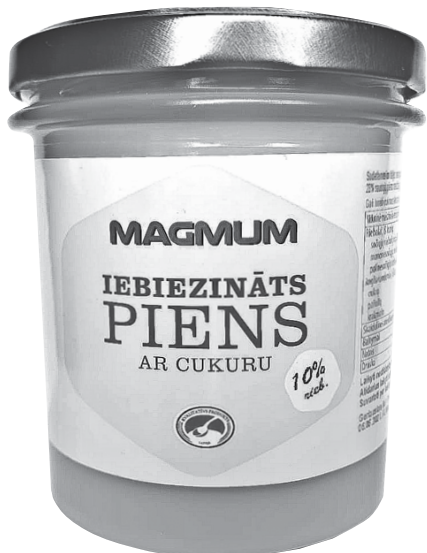
No dabīgām izejvielām top dažādu garšu iebiezinātais piens, kurā nav e- vielu, emulgatoru, stabilizatoru un citu veselībai kaitīgu vielu.