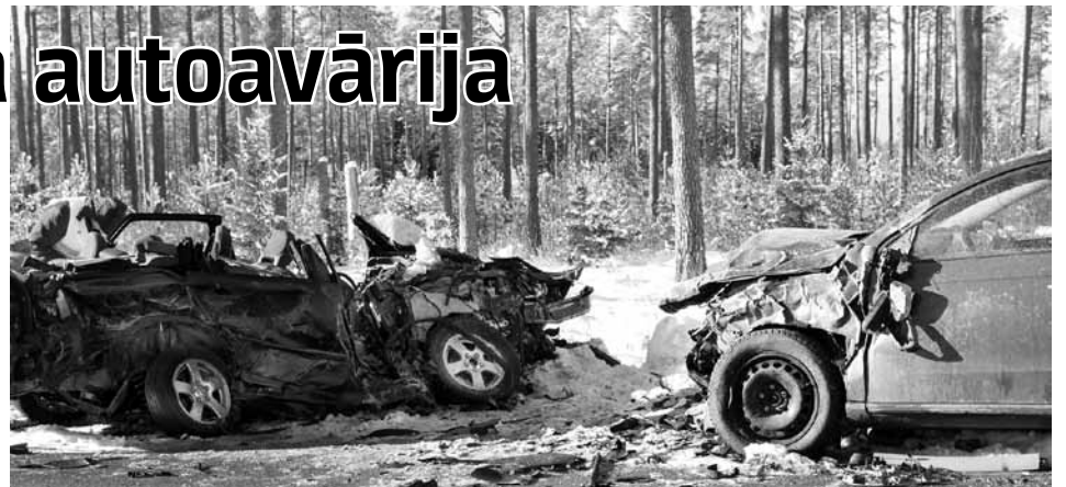
Avārijā saskrējušās divas vieglās un kravas automašīnas, ir divi cietušie un divi bojāgājušie.

Ceļu satiksmes negadījumā, kas notika netālu no Rendas virzienā uz Sabili pie pagrieziena uz Ģibuļiem un kurā iesaistītas divas vieglās un kravas automašīnas, ir divi cietušie un divi bojāgājušie.