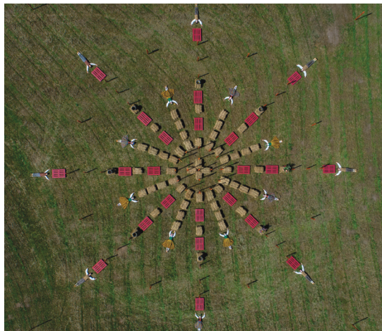
Brīvdabas objekts „Ligo vainags” Ropažu muižas parkā, 2020. gada jūnijs (kopija)

Pastāvīgākais un vismazāk pandēmijas ierobežojumu skartais kultūras notikums bija izstādes. Pavisam 2020. gadā Ropažu Kultūras un izglītības centrā apmek-