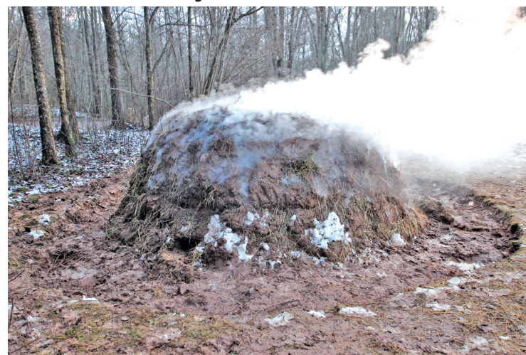
Krāvums degšanas laikā

Eksperimentālā projekta otrā daļa paredzēta 2021. gada pavasarī, kad kokogles tiks nogādātas laboratorijās: tiks noteikta to kvalitātes pakāpe, un pēc tam, lai izpētītu kokogļu īpašības, vēstu-