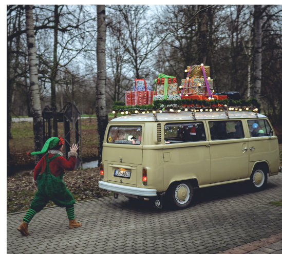
Ziemassvētku Gaismas rūķa busiņš, 2020. gada decembris