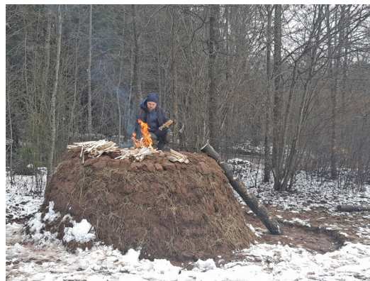
Kokogļu krāvuma aizdedzināšana