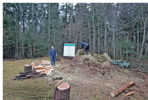
Kokogļu krāvuma noseģšana ar velēnu