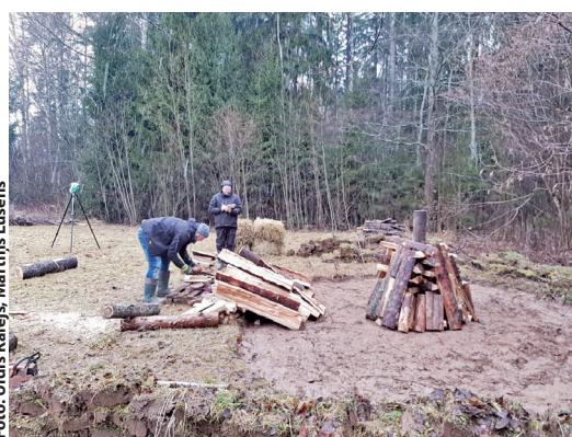
Kokogļu krāvuma veidošana