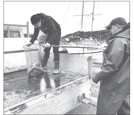
Zvejniekiem liels prieks, ka pašu izaudzētie taimiņi sāk atgriezties Rojas upē.