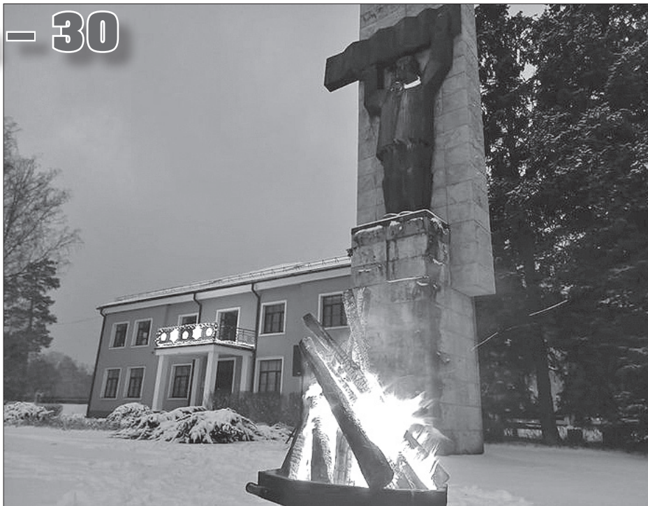
13. un 20. janvāra vakaros pie Rojas KV dega uguns kurš un tika atskanotas barikāžu laika noskaņai atbilstošas dziesmas un Latvijas Radio skanējušo ziņu pārraižu fragmenti.

Iesākot barikāžu piemiņas nedēļu, 13. janvāra vakarā pie Rojas kultūras centra tika iedegts uguns kurš, atskanotās tā laika noskaņai