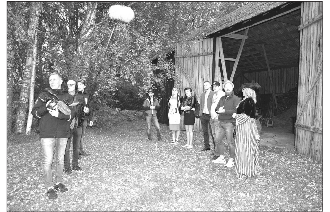
Rit pēdējie „Lauku sētas” filmēšanas darbi Ģipkas „Jokos”.