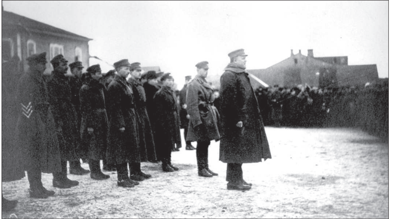
К. Улманис в Даугавпилсе в феврале 1920 года.