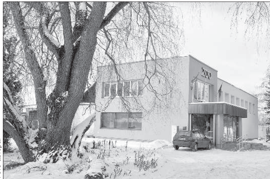
Обитатели Латгальского зоопарка.

Также продолжается осуществление поддержания Даугавпилсской думой проекта, предусматривающего создание Болотария. На Болотарии планируется установить камеры, которые позволят жителям наблюдать за происходящим на территории – как гнезду-