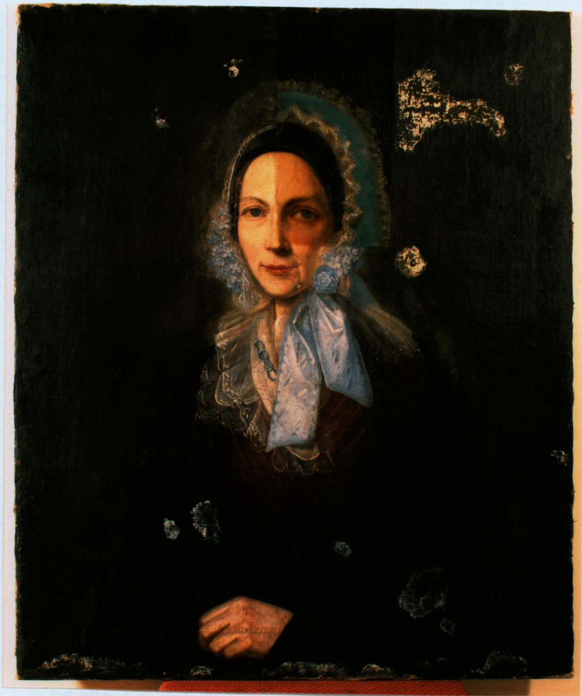
Restaurācijas procesā, pārgleznojumu noņemšana.