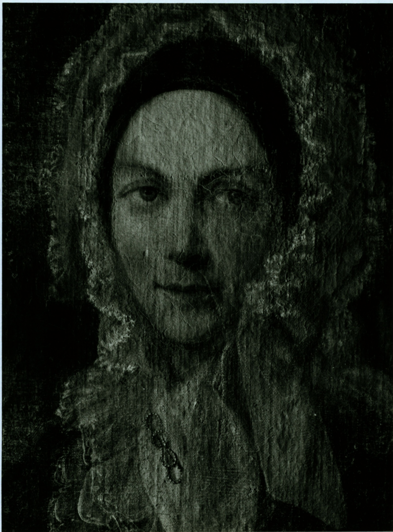
Fragments pirms restaurācijas