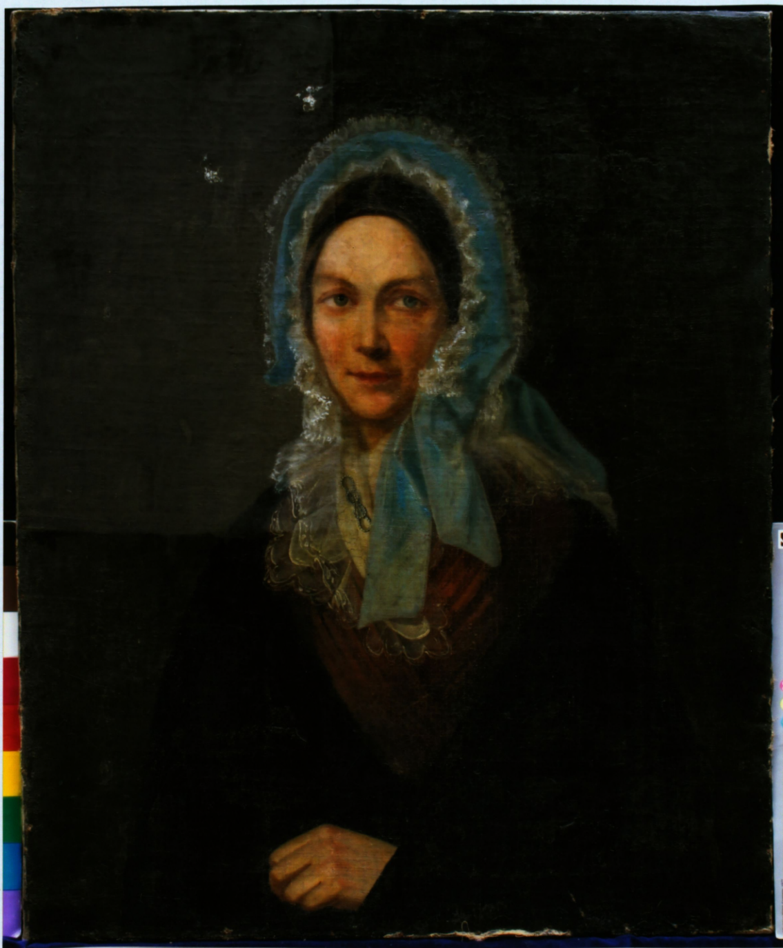
Vitaspuses kopskats. Sõida pörgtegujumi noyemšänd.