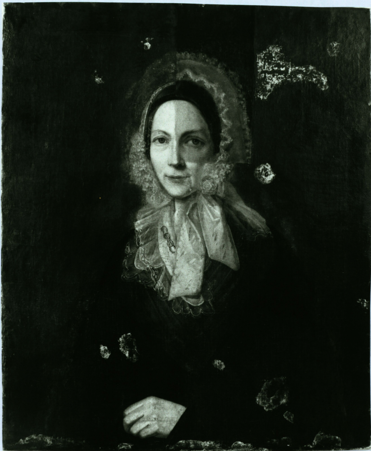
Restaurācijas procesā, pārgleznojumu noņemšana.