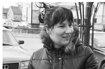
Skaista, droša, varētu būt pārticīgāka. Santa