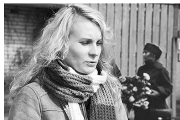
Ļoti zaļa, zaļš plankumiņš, Rīga – rosība, pārējā Latvija – tukši plašumi, pamestība. Gunta