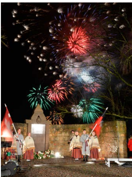
Autors: Spodra Purviņa. 1. vieta

Jēkabpils pilsētas pašvaldības Sabiedrisko attiecību nodaļas tūrisma organizatore