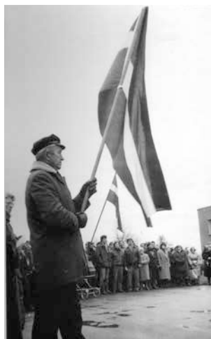
Sarkanbaltsarkanā karoga svinīga pacelšana virs mežrūpnieku kantora (MRS) 1988. gada 18. novembrī

dīts betona piemineklis Ļeņinam. Tēlnieks Sergejs Merkurovs.