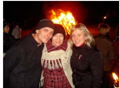
Autors: Sigita Draško. 3. vieta

Elīna Serkova, Jēkabpils pilsētas pašvaldības Sabiedrisko attiecību speciāliste