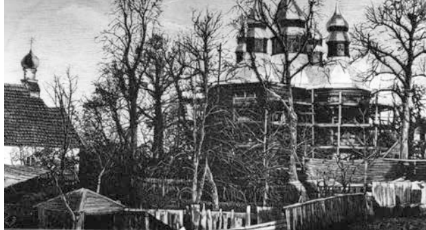
Skats uz Jēkabpils pareizticīgo Sv. Gara un Nikolaja baznīcām. 1889. gads

18. novembris. 1923. gadā pie Krustpils luteriskās baznīcas tiek iestādīti 14 ozoliņi, pieminot Latvijas atbrīvošanas cīņās kri-