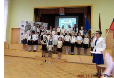
Autors: Irina Uvarova-Grāvīte. 2. vieta