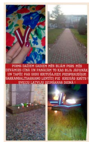
Autors: Raivita Strumpe. 3. vieta

Elīna Serkova, Jēkabpils pilsētas pašvaldības Sabiedrisko attiecību speciāliste