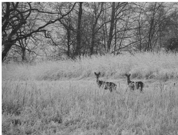
Viena no Jāņa dabas bildēm šoziem. Un viena no tām bildēm, kuras dēļ pāris stundas pavadītas, lai nokertu šo brīnišķīgo kadru

Pirmie soļi uz foto pasauli sākās pie fotogrāfa Kārļa Mellupa. Man, pavisam mazam zēnam, tā foto būšana ļoti ieinteresēja. No mātes puses radnieks Jānis Apsa arī bija fotogrāfs. Es sāku