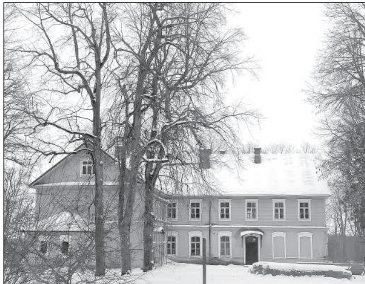
Бывшее Берзгальское поместье.