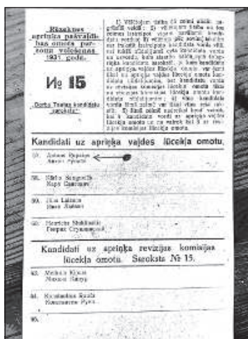
Бюллетень выборов самоуправления Резекненского округа (1931 год).

В Берзгальской волости родился исследователь природы Владислав Боярс, в 1933 году он окончил Аглонскую католическую гимназию. 13 Он известен также как лингвистический своеобразный, прямой в своем выражении и суровый лирик. 14 Он действительно мог сравнить Аглонский и Берзгальский хра-