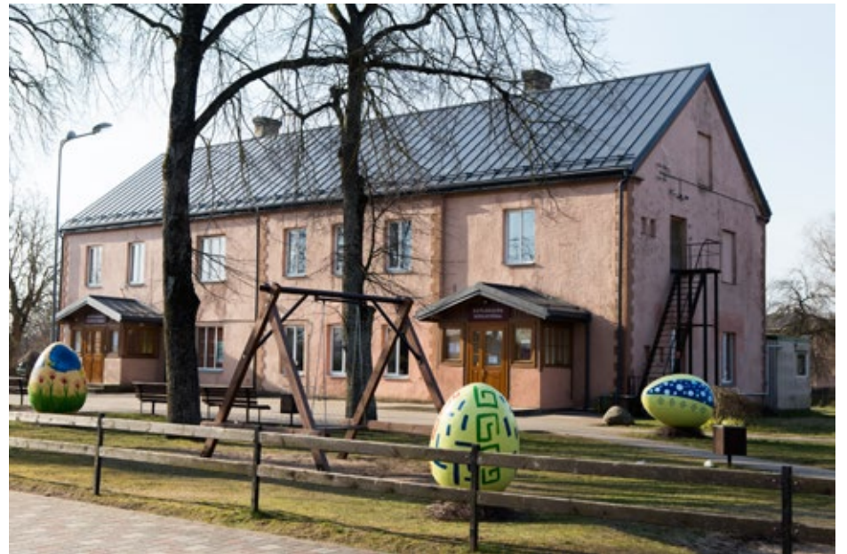
Katlakalna Tautas nams 2020. gada pavasarī tika pie jauna skārda jumta.

Baložu vidusskolā veikti kosmētiskie remontdarbi divās mācību telpās, kā arī uzbūvēts vējtveris.