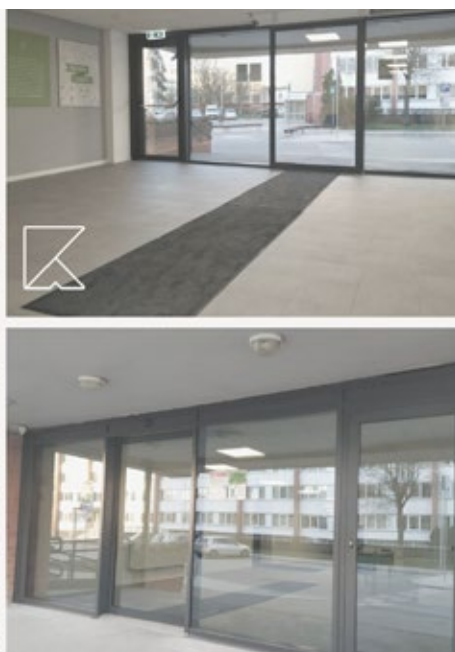
Nodrošināta vides pieejamība pašvaldības Klientu apkalpošanas centrā Ķekavā.