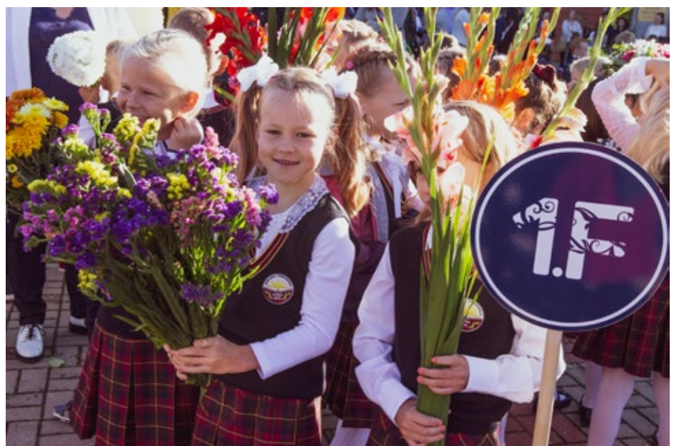
2020./2021. mācību gadā Ķekavas novadā skolas gaitas uzsāka 345 pirmklasnieki.

Vairāk nekā 17 000 eiro izmaksāti Ķekavas novada vidusskolēnu stipendijām par