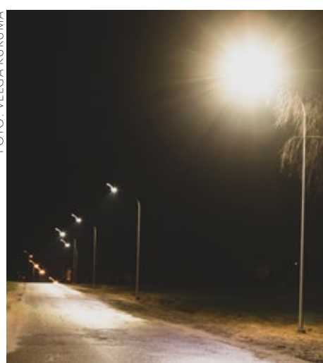
Jaunais LED apgaismojums Odukalnā

Tāpat jauns LED apgaismojums izbūvēts Ķekavā, Odukalna ielas posmā no Saules ielas līdz autoceļam A7. Vēsturiski bija izveidojusies situācija, ka blīvi apdzīvotajā