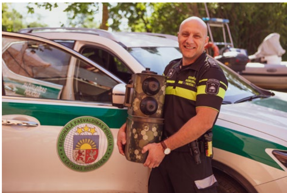
Iedzīvotāju drošības nolūkos Reģionālā pašvaldības policija pilnveidojusi videonovērošanas sistēmu novadā, un šie darbi tiks turpināti arī 2021. gadā.

Par ieguldījumu Ķekavas novada attīstībā piešķirts apbalvojums "Ķekavas novada Goda pilsonis" trīs novadniekiem – režiso-