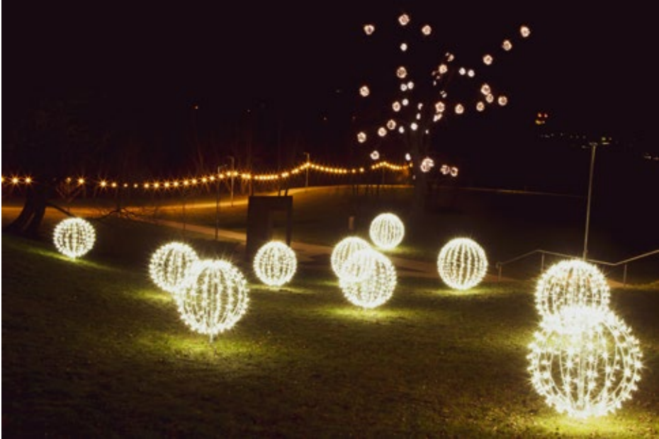
Ķekavas novada iedzīvotājus un viesus priecēja skaistie Ziemassvētku vides rotājumi.