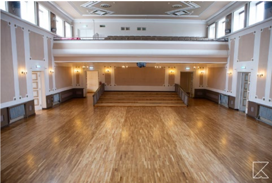
Baložu kultūras namā atjaunota koka parketa virskārta Lielajā zālē un Kora zālē, kā arī šo zāļu vestibilā.

labām sekmēm. 2020./2021. mācību gada rudenī stipendijas saņēmuši 48 audzēkņi. Lai atbalstītu Ķekavas novadā dzīvojošās ģimenes, kuru bērniem ārkārtējās situācijas laikā mācību process norisinājās attālināti, izsniegtas 2733 brīvpusdienu pakas, šim mērķim izlietojot gandrīz 70 000 eiro. Ķekavas novadā reģistrējušās vairāk nekā 207 aukles, kuras kopumā pieskata 373 bērnus. Papildus pašvaldība apmaksā vietas privātajos bērnudārzos 335 bērniem. Ķekavas novada pašvaldība 2020./2021. mācību gadā līdzfinansējusi Ķekavas novadā deklarētajiem 211 bērniem pamatzglītības programmas apgūšanu privātajās mācību iestādēs.