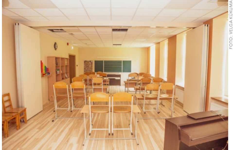
Daugmales pamatskolas pārbūves laikā tika pārbūvēta arī zāle par transformējamo telpu-mācību klasi.

Pie Ķekavas Mūzikas skolas uzstādīts vides objekts "Nots" projekta "Tūrisms kopā" ietvaros, kuru īstenoja trīs vietējās