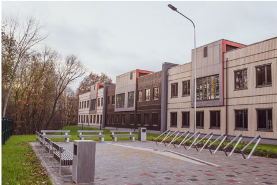
Ķekavas vidusskolas jaunais korpuss.

Nosiltinātas divas daudzdzīvokļu dzīvojamās mājas Ķekavā – Rīgas ielā 36, k. 3, un Nākotnes ielā 8. Uzsākti 122 dzīvokļu ēkas energoefektivitātes uzlabošanas darbi Ķekavā, Nākotnes ielā 36.