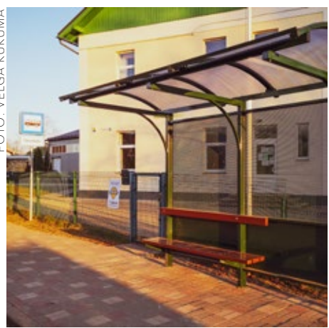
Jaunā pieturvietas nojume.