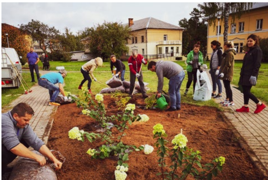
Pirmo reizi Ķekavas novadā tika rīkota vides akcija "Iestādi koku", kuras laikā tika iestādīti 63 koki un dekoratīvie krūmi.