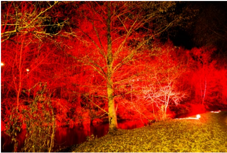
2020. gadā, atzīmējot Latvijas dzimšanas dienu, pirmo reizi Ķekavas novadā tika organizēta gaismas pastaiga "Gaismu sauca, gaisma ausa".

mi un 38 uzturu speciālistu meistarklases, 25 izglītojoši un praktiski dienas pasākumi, kā arī īstenoti trīs vispārējās profilakses pasākumi garīgās veselības veicināšanai, vispārējo veselības parametru noteikšanai un izpratnes veicināšanai par to nozīmi veselības uzturēšanā.