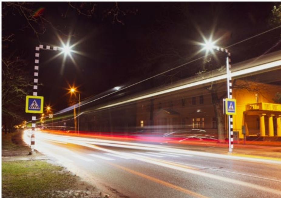
Gājēju drošībai izbūvēts speciālais apgaismojums divām gājēju pārejām Baložu pilsētā, Rīgas ielā.