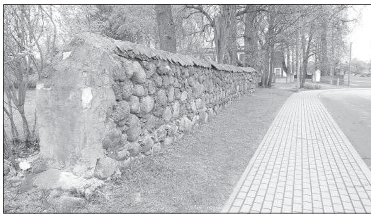
Садовая стена у храма.

Озолмуйжа располагались ремесленные поселки или слободки, в 1913 году было решено открыть здесь ремесленное училище. И какие современные словечки были в газетах того времени! «Правление Резекне начало думать о новых проектах, которые пойдут на пользу всему округу. (...) В Озолмуйже решено открыть школу кузнечного ремесла». 4 Вместе с кузнечным ремеслом в школе будут преподавать столярное дело и другие ремесла». 5