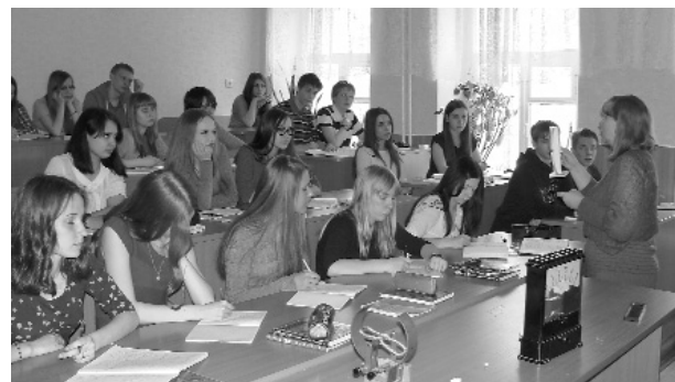
Mācību stundas Vjatkas humanitārajā ģimnāzijā

Skolēni vairākkārt atzīst, ka šis brauciens ir bijis pozitīvs un ļoti izglītojošs, tāpat domā arī viņu vecāki, prie-