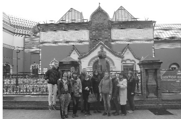
Jautrais brīdis slidotavā, Smiltenes ģimnāzijas skolēni kopā ar Vjatkas humanitārās skolas audzēkņiem

cājoties par to, ka skola sniedz iespēju aizbraukt uz citām valstīm, lai paplašinātu savu redzesloku.