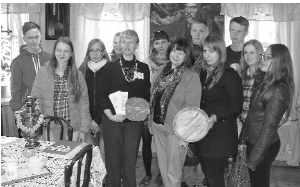
Foto mirklis Raiņa muzejā, Slobodskā