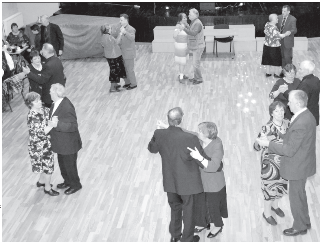
Ugāles seniori satikušies deju zālē.