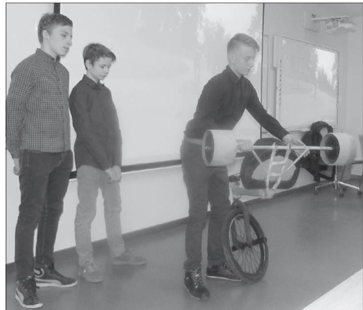
Puiši izgatavojuši "drift trike" velosipēdu.