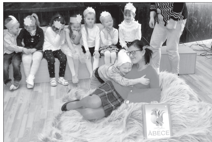
Tince samīļo mazo lasītprateju.

Kopā būšana bija lieliska iespēja ikvienai Ventspils novada izglītības iestādes pirmsskolas radošajai grupai piedalīties svētkos, attīstīt savus talantus un spējas radošā, draudzīgā gaisotnē, veicināt katra pasākuma dalībnieka adaptāciju un integrāciju sociālajā vidē, prasmi darboties komandā. Tāpat tiek veicināta sadarbība un saliedētība starp novada izglītības iestādēm, nodrošinot pieredzes apmaiņu pirmsskolas pedagogiem.