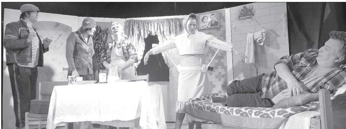
Skats no izrādes "Nedienas Apriņos".

19. marts Usmas amatiereteātra kolektīvam "Suflē" iesākās citādā nekā parasta sestdiena. Klāt bija pirmizrādes diena, lai gan jau sestā pēc kārtas, bet nekas nebija tā kā visas iepriekšējās reizes. Jau no paša rīta katrs no aktieriem piedomāja, vai viss padarīts tā teikt "uz ūsiņu". Galvas pilnas ar to, vai viss ir savās