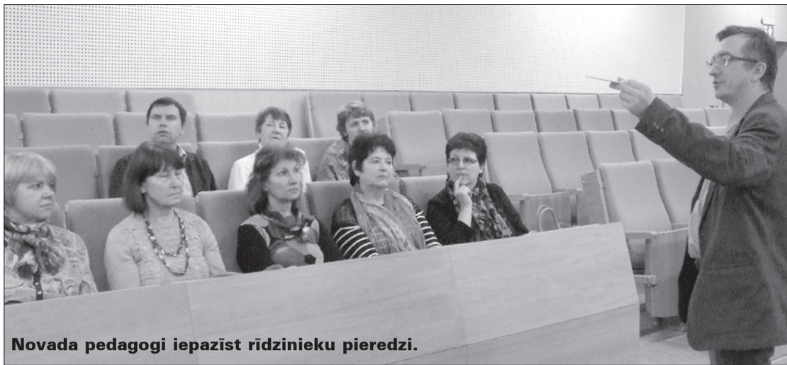
Novada pedagogi iepazīst rīdzinieku pieredzi.

Mūsu novada pedagogi apmeklēja arī AS "Grindeks" – vadošo zāļu ražotāju Baltijas valstīs – un iepazīnās ar mūsdienīgi moderno ražotni, mikrobioloģijas laboratorijām un procesu, kā tiek pārbau-