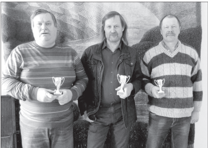
Pirmo trīs vietu ieguvēji ar kausiem.