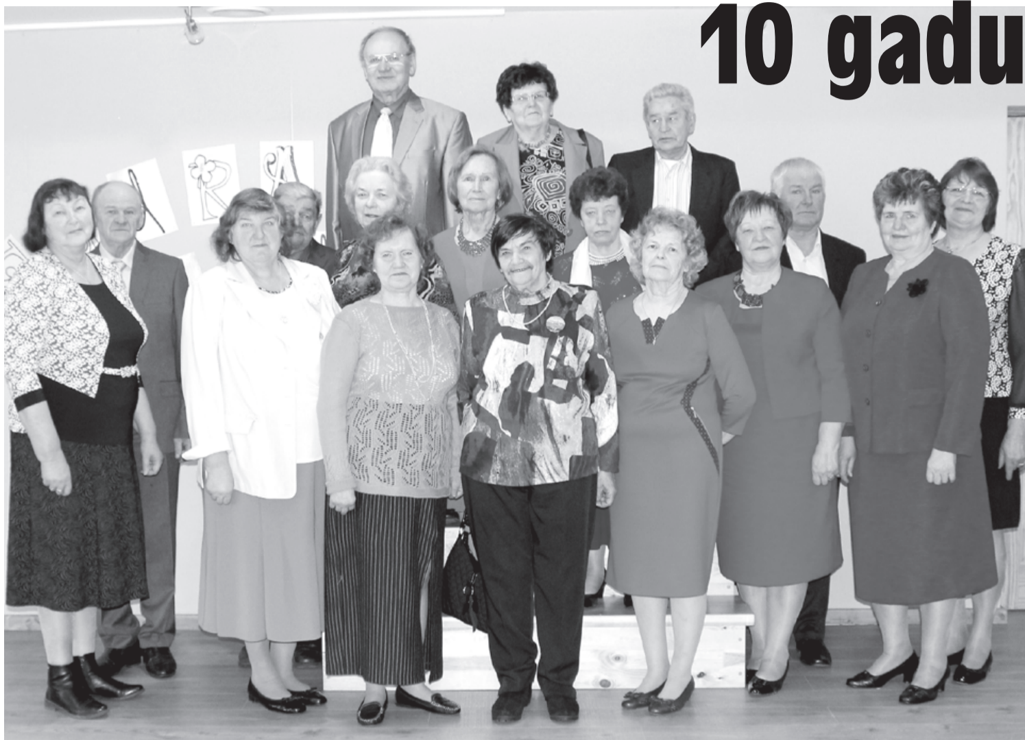
Gaviļnieki un atbalstītāji "Sudrabortājās melodijās".