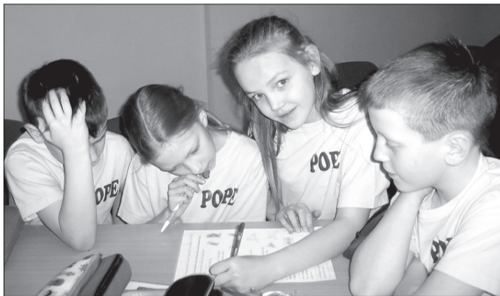
Pie uzdevuma ķērušies Popes komandas pārstāvji.

Ugāļniekiem divas komandas un līdzī bija divas Mazās raganiņas, kuras gribēja izvēlēties sev skolu, tāpēc ieklausījās, kā komandas reklamē Ugāles vidusskolu. Viena no tām savu skolu ieteica tāpēc, ka tajā ir daudz dažādu ārpuskolas un sporta nodarbību, var vērtīgi pavadīt brīvo laiku, ka labākie skolēni saņem Zelta un Sudraba liecības; otra komanda pievienojās un teica, ka skola dod arī bagātības, kas nav taustāmas,