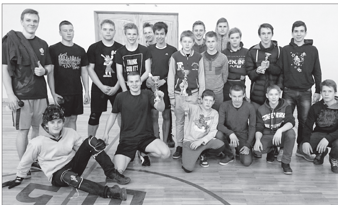
Skolēni, kam patīk spēlēt florbolu.