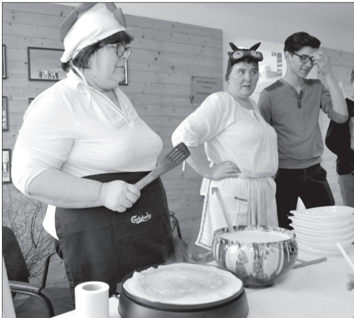
Saimnieces gatavo pankūkas.