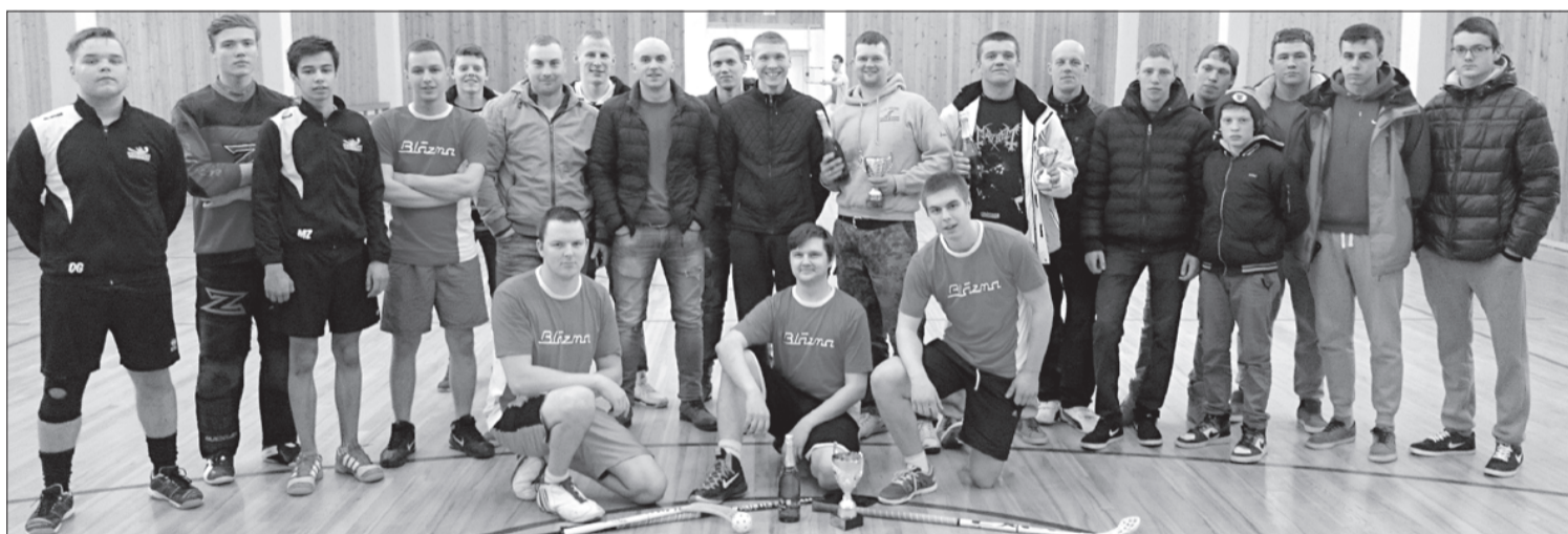
Ventspils novada florbola spēlētāji.

Kopā sacensībās "Puzes kauss" tika nospēlētas 10 spēles, kurās