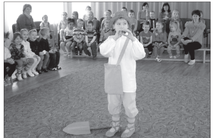
Sprīdītis dodas ceļā