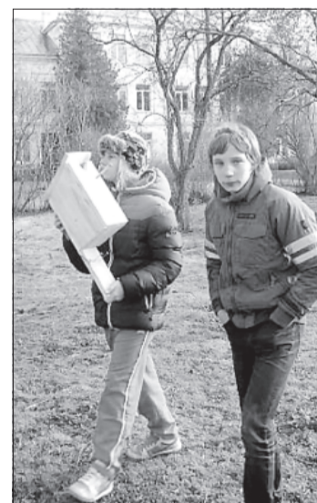
Tuliņ būs atrasts putniņu mājoklim piemērots koks!

Ir brīnišķīgi skaista šī zemīte mana, Šīs Latvijas pļavas un āres, Pa kurām mēs staigājam basām kājām, Kur bites vāc medu uz mājām.