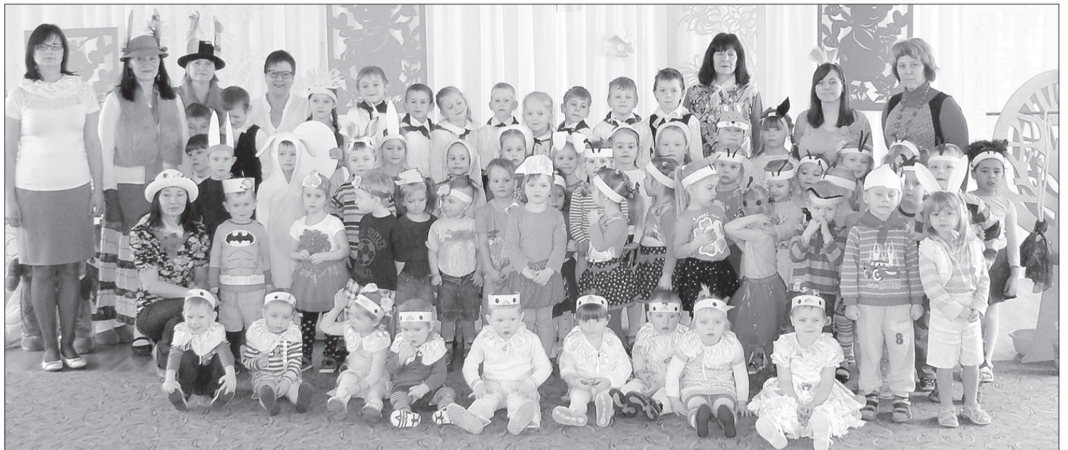
Teātra nedēļas dalībnieki.

Pirmajā dienā pie mums ciemojās Nikolaja Nosova Nezinītis, kurš devās ceļojumā uz Saules pilsētu, līdzi ņemot arī savus draugus. Viņu lomās iejutās grupas "Pūcītes" (seši gadi) audzēkņi. Otrajā dienā visi tikās ar nopro puisēnu Sprīdīti. Ar latviešu tautas pasaku mūs iepazīstināja grupas "Sprīdīši" (pieci gadi) bērni. Drosminieks cīnījās gan ar Lutausi, gan velnu. Bērnu no milža atbrīvoja, bet kaprīzo princesi par sievu neņēma un secināja, ka tik labi kā mājās nav nekur. Teātra nedēļas trešajā dienā savu iestudējumu – Alberta Kronenberga "Pieci kaķi" – rādīja paši mazākie iestādes audzēkņi no grupas "Ezīši" (1,5–2