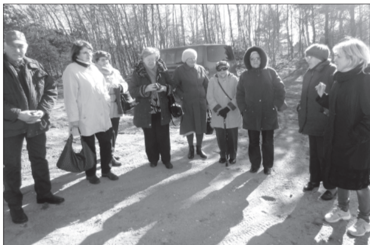
Viesi no Gāliņciema bibliotēkas iepazīst Užavu.