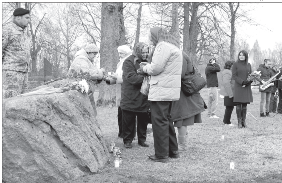
Pie piemiņas akmens gulst izsūtīto ziedi.