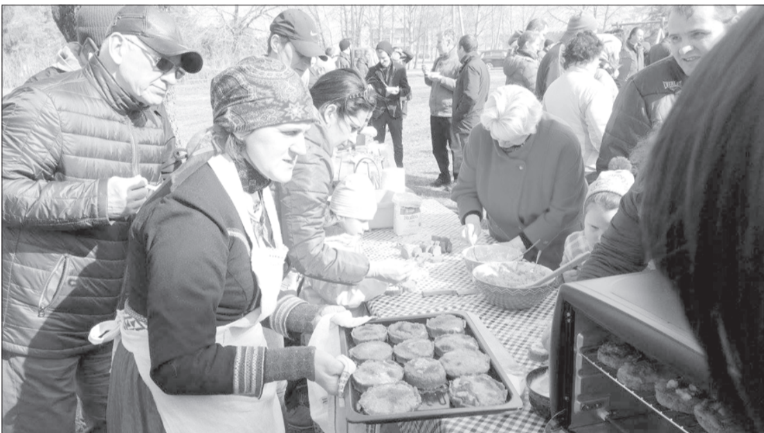
Saimniece Taiga māca, kā izcept gardu sklandrausi.

Jūrkalnē Lieldienas svinēja ar dejām, rotaļām, mīklu minēšanu, ticējumiem, sklandraušu cepšanu un olu ripināšanu.