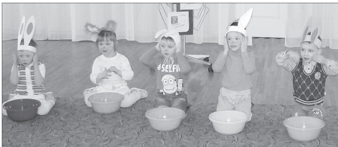
Mazie zaķēni mazgājas.