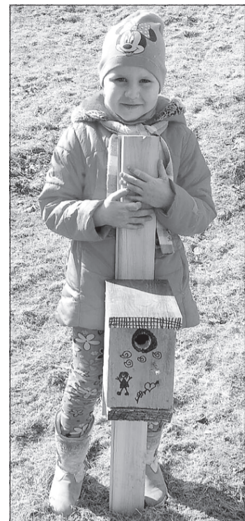
Putnu būritis gatavs!

Šāds pasākums pierādīja jau sen zināmo patiesību, ka bērni ļoti labprāt iesaistās dažādās aktivitātēs