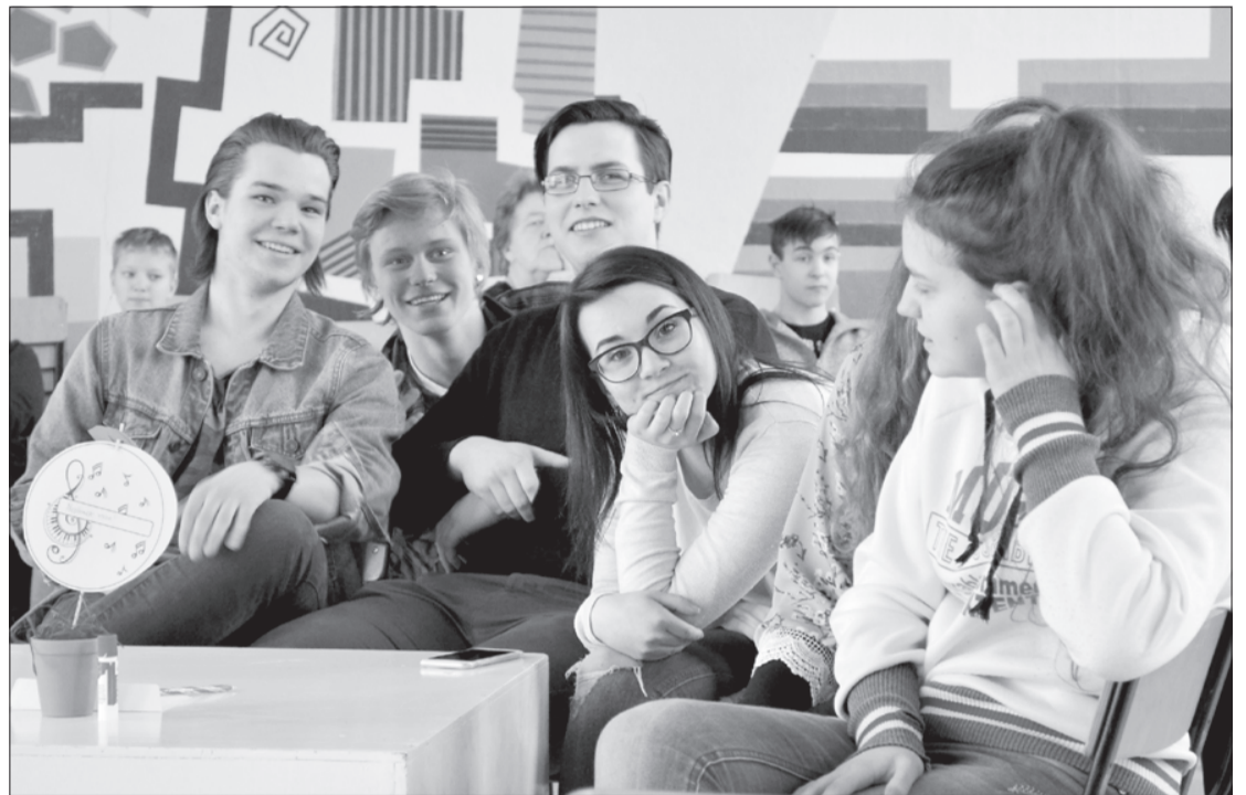
Komandu, kas uzvarēja, pārstāvēja 11. klases audzēkņi.