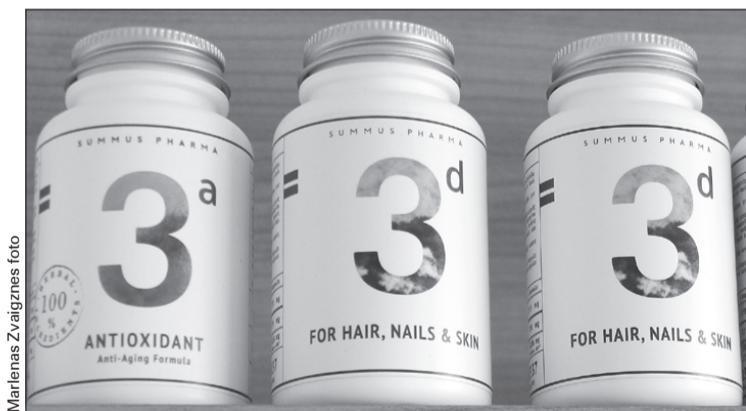
Pagaidām pieejami trīs uztura bagātinātāji.