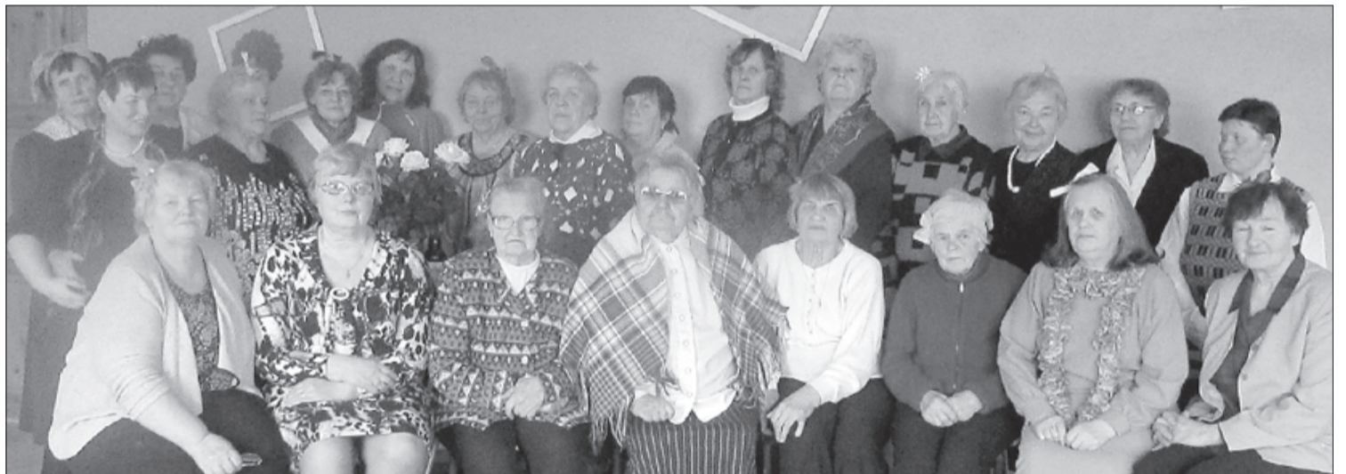
"Vīgriezes" pulcējušās svētku reizē.