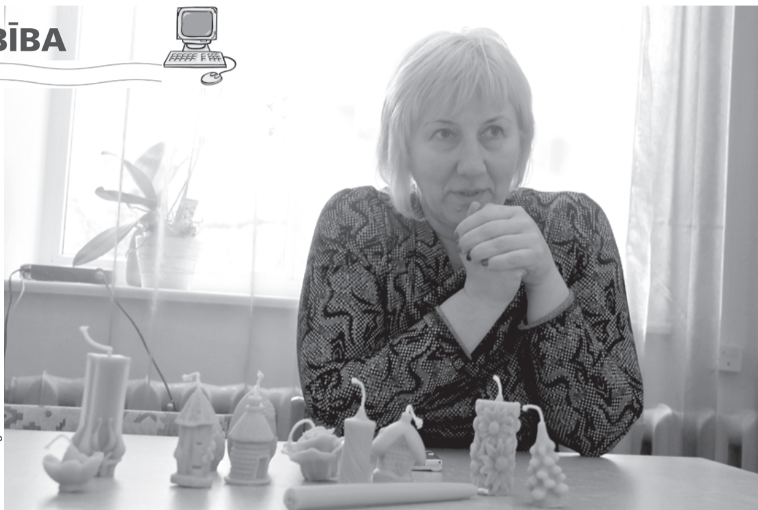
Ances pamatskolas direktores vaļasprieks ir biškopība. Nesen viņa ar vīru sāka liet vaska sveces.