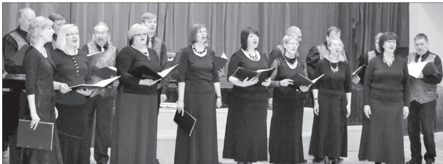
Ugālē uzstājas viesi no Stendes.