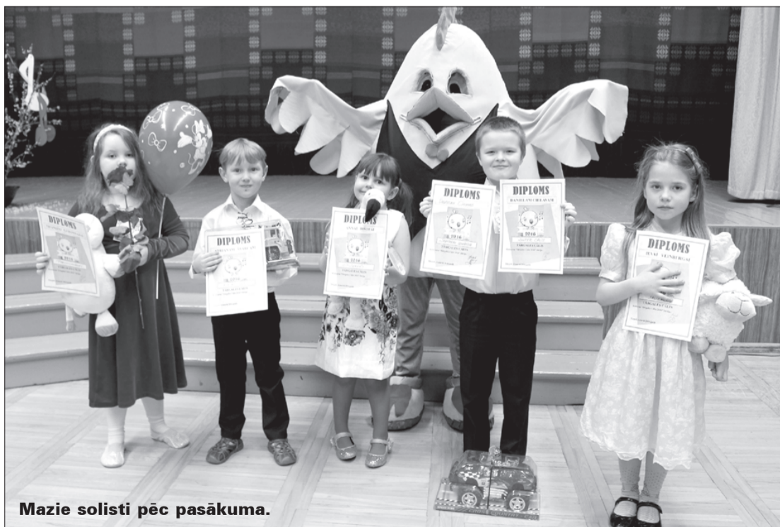
Mazie solisti pēc pasākuma.

Šogad pie bērniem bija ieradies Lielais Cālis un Gailis, lai precētos par mazajiem dziedā-