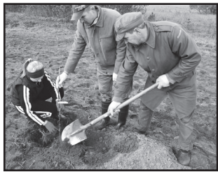
ceri, esam dāvājuši SAC „Aglona” iemītniekiem daudzveidīgām šķirņu bagātu augļu dārzu, kurā sev

SAC „Aglona” iemītnieku sirdīs ir iemājojusī prieka dzirksts, kas nespēs izdzist vēl ilgi jo ilgi. Šo nevilto prieku un gandarījumu par paveikto darbu ir sniegusi biedrība „Preiļu rajona partnerība” un Aglonas novada dome, apstiprinot Mazo grantu projektu konkursā „Iedzīvotāji veido savu vidi” iniciatīvas grupas iesniegto projektu „Augļu koku un krūmugulāju iegāde SAC „Aglona” iemītnieku veselīga uztura un māju sajūtu radīšanai”.