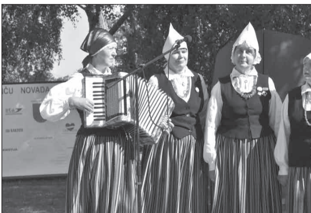
Folkloras kopa "Mežābele" pārstāvēja Jērcēnu pagastu, dziedot dziesmu par ozolu, jo pagasta simbols ir Kaņepju ozols