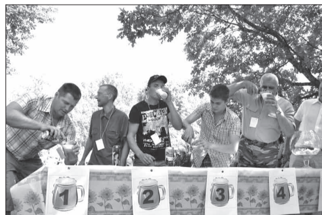
Skaļu skatītāju atbalstu izpelnījās alus ātrderšanas sacensību dalībnieki