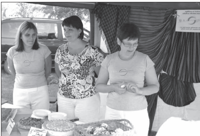
Strenču novada kultūras un izglītības atbalsta biedrība "Šūpolēs" svētkos organizēja akciju "Kūku kūka 2011"