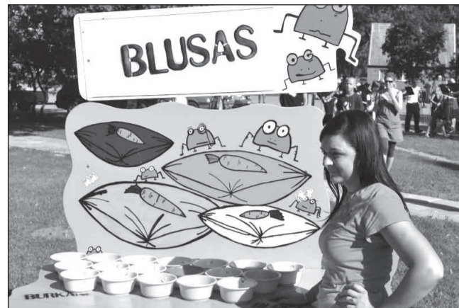
Positīvās atrakcijas "Burkāni" piedāvāja interesantas un azartiskas atrakcijas bērniem un pieaugušajiem