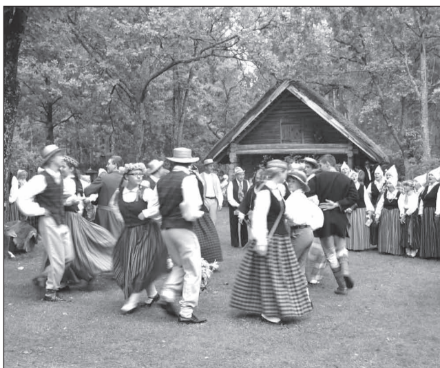
Folkloras kopas jaunieši visus aicināja uz jautriem dančiem

Svētdien, 14.augustā Latvijas Etnogrāfiskā brīvdabas muzeja Vidzemes sētā notika Vidzemes novada diena, kurā 17 labākās Vidzemes folkloras kopas izdzīvoja "Kāzu godus Vidzemē". Pasākumā piedalījās arī Jērcēnu "Mežābele".