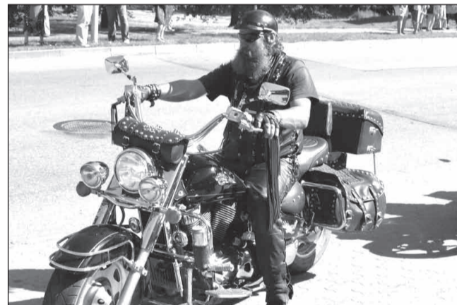
Publikas interesi saistīja rokeru iebraukšana pilsētā un rokeru parādē