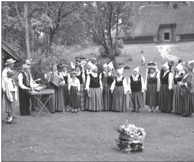
"Mežābele" Vidzemes novada dienā Brīvdabas muzejā, piedaloties Kāzu godos