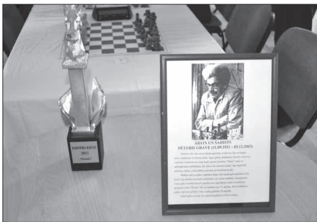
Daktera kauss 2011, ko turnīram sponsorē Graves ģimene