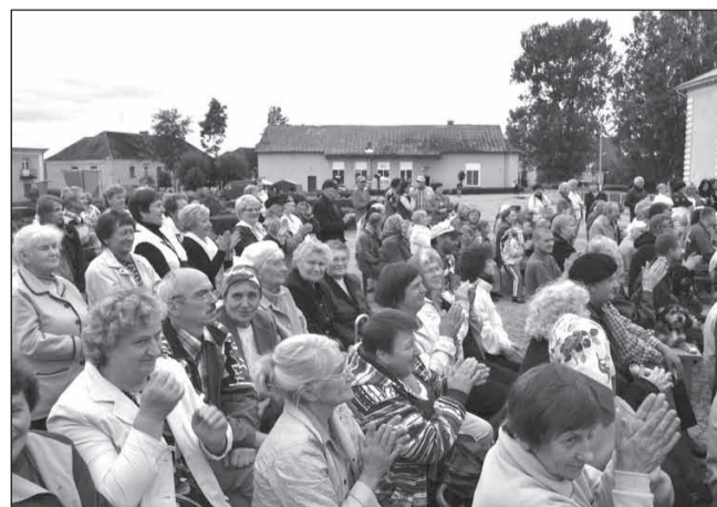
Koncertā Sedas pilsētai – 20