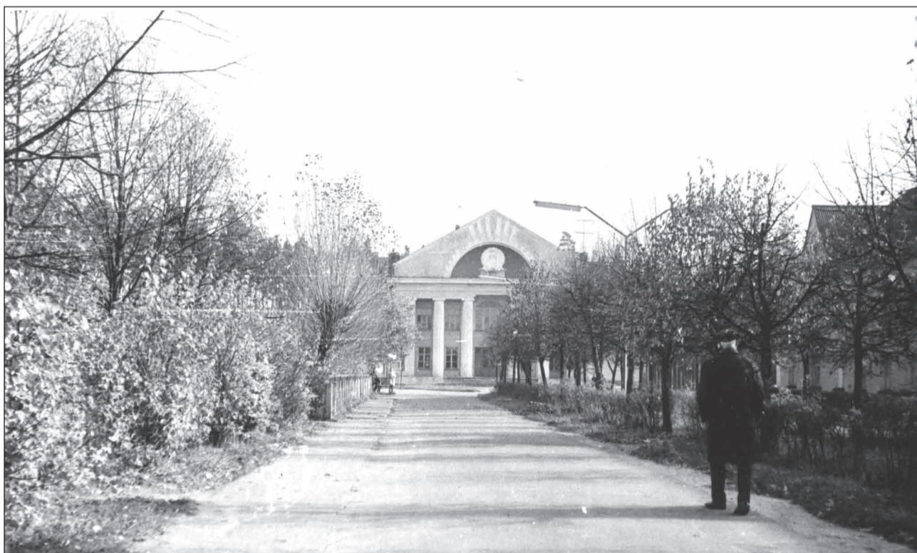
Sedas kultūras nams

SIA "Agroprojekts" pabeidzis Sedas kultūras nama rekonstrukcijas tehniskā projekta izstrādi. Izsludināts atklāts konkurss rekonstrukcijas darbu veikšanai. Rekonstrukcijas laikā tiks veikti ēkas fasādes apdares darbi, jumta seguma remontdarbi, logu ailu un rāmju remonts, stiklojuma atjaunošana, ieejas pakāpienu remonts, izbūvēts ieejas mezgls cilvēkiem ar īpašām vajadzībām, atjaunota elektroinstalācija, sakārtota ūdensapgādes un kanalizācijas sistēma, sakārtota apkures sistēma, daļai iekštelpu veikti iekšējie apdares darbi un atjaunots grīdas segums, izveidotas piemērotas telpas personālam, izbūvēta skatuve, garderobe un tualetes.