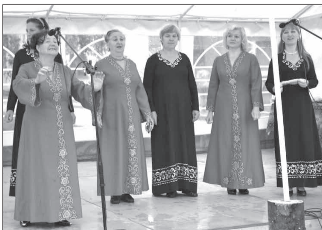
Sedas pilsētas ansamblis “Sudaruška”