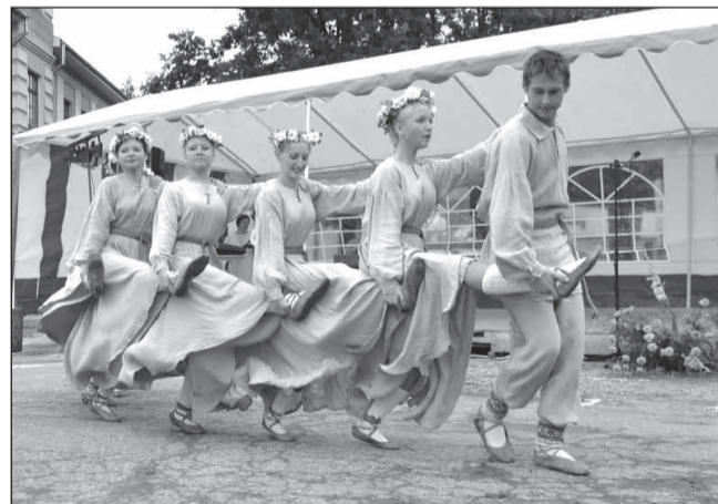
Ciemiņi – Alūksnes novada Pededzes pagasta jauniešu deju kolektīvs