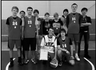
Aglonas vidusskolas komandas sastāvs: