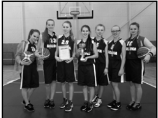
Aglonas vidusskolas meiteņu komandas sastāvs: