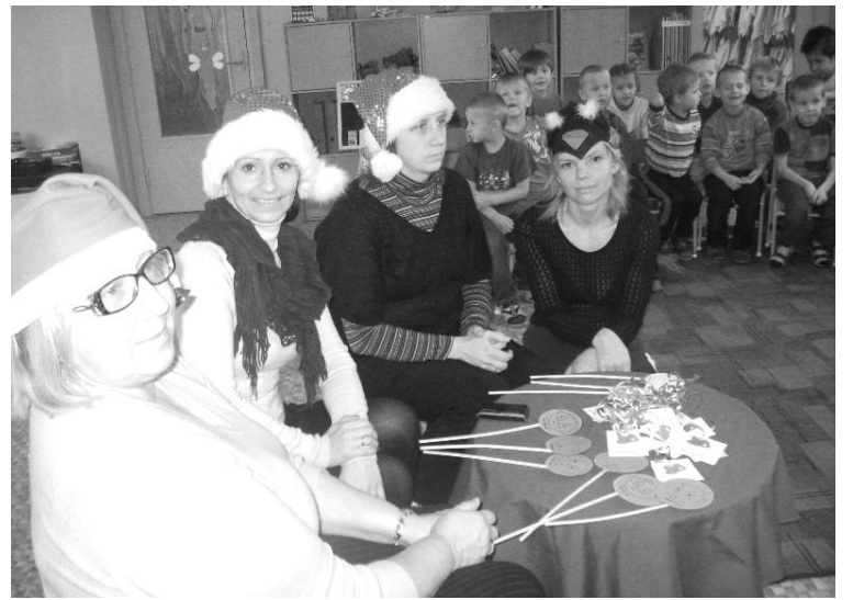
Daiļrunātāju konkursa atraktīvā žūrija

31. oktobrī, gatavojoties Mārtiņdienai, bērņus iepazīstinājām ar savdabīgu Mārtiņdienas svinēšanu ārzemēs – Helovīnu. Tika piedzīvota ķirbja pārvērtības – līmēti, krāsoti, garšoti ķirbji, bet vēlāk izgatavotas ķirbju laterniņas gaismai un siltumam, sagaidot gada tumšāko