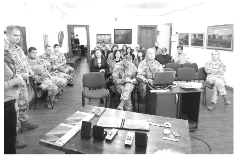
Kājnieku skolas karavīri, kas piedalījušies starptautiskajās misijās, pasākuma dalībniekiem stāstīja par pieredzēto