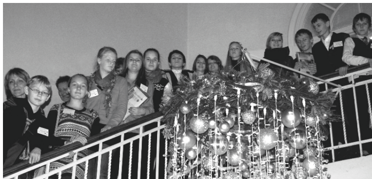
Alūksnes novada mazpulcēni Jelgavā

Konferences dalībniekiem bija skatāma Latvijas mazpulku ceļojošā izstāde. Šajā izstādē bija apskatāmas fotogrāfijas un lasāma informācija arī par Ilzenes, Strautiņu un Ziemeru mazpulku darbību.