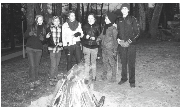
„Pagātnes spēlēs” piedalījās astoņas jauniešu komandas no Alūksnes un Apes novadiem

Dalībnieki atklāja sev iepriekš nezināmus faktus, pārvarēja kautrīgumu, lai garāmģājējam apjautātos par