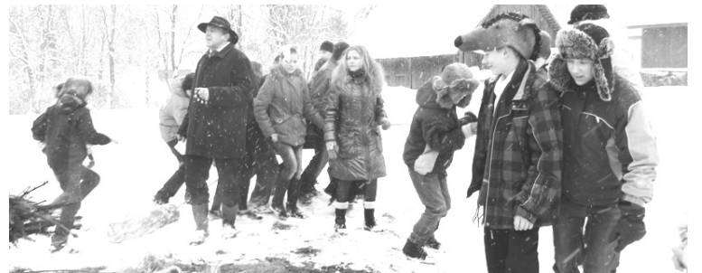
Kopā ar Medeņu ģimeni Bejas pamatskolēni iepazīna latviskās Ziemassvētku tradīcijas

Taču Ziemassvētkos neiztikt arī bez blūka vilkšanas, kura simboliskā nozīme ir visa jaunuma sadedzināšana, gaismas uzvara pār tumsu. Tamdēļ katrs iebāza blūka spraugā lapiņu ar savu nedarbu. Kam lapiņas nebija, tas izlīdzējās vienkārši ar sniegu. Protams, arī blūka vilkšana neiztika bez skanīgām Ziemassvētku