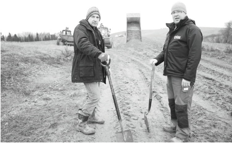
Alūksnieši ne tikai plāno maršruta kartes uz papīra, bet neslīko arī paši, un, ja to vajag rallijam, ir ar mieru uzbūvēt pat jaunu ceļa gabalu

solītais pasaules gals 21. decembrī, Ziemassvētki, Jaunais gads un tad jau ir pēdējais laiks posties uz Alūksnes pusi!