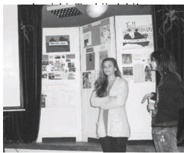
Strautiņu pamatskolas skolēni ar interesi uz klausīja viesu stāstījumu

Ārzemju jaunieši ļoti brīnījās par mūsu skolas vecumu, kas ir rakstīts uz skolas akmens. Neticēja, ka tā ir tik sena celtnē. Arī skolas aktu zālē ļoti patika, jo tajā visi iegāja ar ārzemniecisku „Woow!” Mums, savukārt, īpaši patika, kā viņi centās