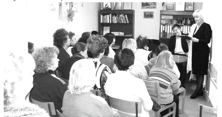
Annā literāri muzikālajā pasākumā daudz apmeklētāju

Ļoti ceram (un arī novēlam), ka Ivetas Krūmiņa un Aivars Osī radīs vēl kādu jauku literāri muzikālu projektu, lai mēs atkal varētu satikties!