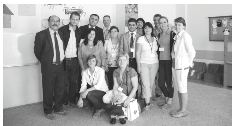
Projekta partneri kārtējās tikšanās laikā

Vispirms mēs apmeklējām pilsētas vadību, tad vietējo sākumskolu un bērnodārzu. Skolas zālē mūs sagaidīja vienādās, gaiši zilās formās tērpti bērni, kuru rokās bija visu 12 valstu karodziņi un plakāti, kuri visās valodās vēstīja - GAIDĪTI. Bērni un skolotāji ar lielu interesi uzzināja, kā izrunāt svešajās valodās uzrakstītos