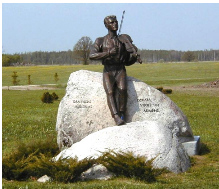
Mākslinieces Vijas Dzintares veidotais piemiņas ansamblis Oskaram Kalpakam Ošupes pagasta "Liepsalās" (veidots 1999. gadā). Oskara Kalpaka tēls (bronza un granīts), Akmens lapu kompozīcija pie dzimtas ozola (granīts)