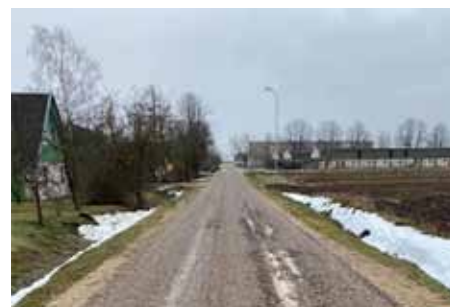
"Izkust" paguva arī ielas divkārtu virsmas apstrāde Vandānos. Būvdarbus veikusi firma solās bojājumus novērst, līdzko to ļaus laika apstākļi.

Iestājoties grants autoceļiem nelabvēlīgiem laika apstākļiem – slapjam sniegam, lietum un atkusnim, daudzviet novados uz grants autoceļiem ir iestājies šķidonis. Pārmitrināts ceļa segums zaudē nestspēju un braukšanas apstākļi pasliktinās. Lai ierobežotu smagā transporta pārvietošanos un nepasliktinātu pašvaldības ceļu stāvokli, uz tiem daudzviet tiek izvietotas zīmes ar transporta masas ierobežojumiem.