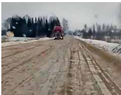
Valsts autoceļš V783 26. februārī teju neizbraucams.