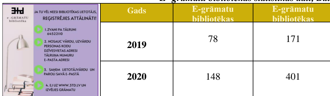
E- grāmatu bibliotēkas statistikas dati, Balvu reģions