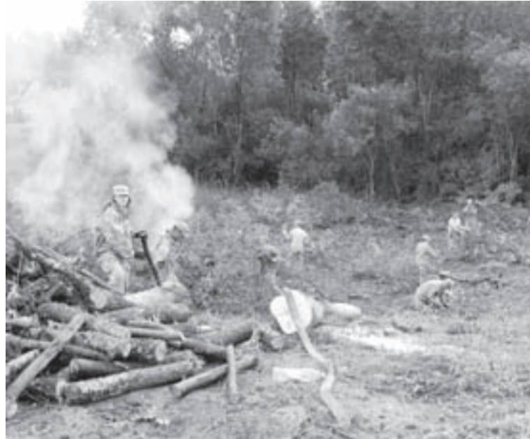
Karavīri no ASV Mičiganas štata Alūksnē piedalījās pilsētvides sakopšanā