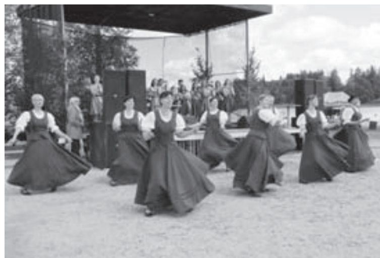
Deju kopa „Jaunanna” priecē skatītājus Alūksnes ezera Zušu svētkos

možumu, enerģijas lādiņu paši sev. Īstenojot projektus un papildus gūstot pašvaldības atbalstu, kolektīvam ir skaisti tērpī. Arī pagājušās sezonā mums ir augsts novērtējums Alūksnes un Apes novadu deju kolektīvu skatē, kur startējām ar deju programmu „Mīļā Māra”. Mīļš paldies visiem darbīgajiem un radošajiem „Jaunannas” dejotājiem! Jubilejas sezonā mūs gaida daudzi un atbildīgi uzdevumi, mēs priecāsimies redzēt savā pulkā arī jaunus dejotgribētājus, lai iepazītos ar dejas daudzveidību, kas padara mūsu ikdienu krāsaināku, jautrāku un veiksmīgāku. Dejtogribētājus aicinām interesēties pie kolektīva vadītājas vai Jaunannas tautas namā.