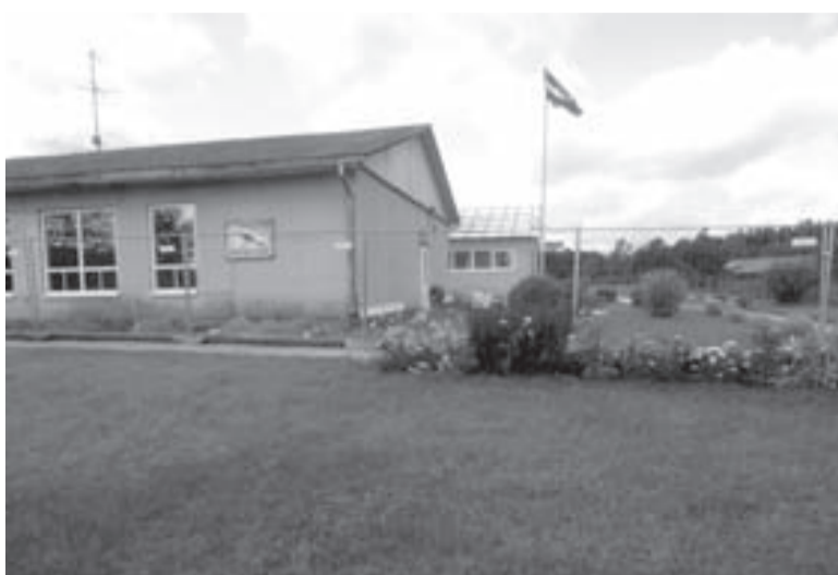
Malienas pirmsskolas izglītības iestādi ieskauj žogs un rit celtniecības darbi

Jaunalūksnes un Malienas pagastu pirmsskolas izglītības iestādēs „Pūcīte” un „Mazputniņš” piedalījās Klimata pārmaiņu finanšu instrumenta finansēto projektu atklātā konkursa „Kompleksi risinājumi siltumnīcefekta gāzu emisiju samazināšanai” ceturtajā kārtā. Šogad 26. jūnijā Vides aizsardzības un reģionālās attīstības ministrija pieņēma lēmumus par abu izglītības iestāžu projektu iesniegumu apstip-