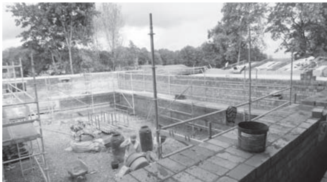
Top jaunā ēka

- Jaunajai ēkai jau ir ielieti pamati, esam uzņēmējuši līdz cokolstāva pārsegumam un šonedēļ sāksim to veidņot. Vecajai ēkai notiek cokolstāva sienu apmešana, tur jau ir izbūvētas komunikācijas un tagad tās būvējam pirmā stāva līmenī. Šobrīd veicam arī jumta darbus – kur bija nepieciešams, tika protezētas koka konstrukcijas, tagad notiek seguma maiņa. Mainām un vēsturiskajai izskatā atjaunojam spāru galus, ieklājam siltumizolāciju, drīzumā uzsāksim