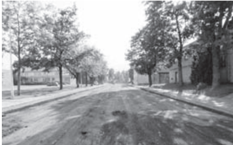
Dārza iela iegūs jaunu segumu posmā no Latgales un Tirgotāju ielas krustojuma līdz Jāņkalna ielai

pirmajās trīs ielās – Brūža, Parka un Dzirnava – jau ir paveikts vairāk. Būvuzņēmēji plāno, ka septembrī, ja laika apstākļi darbu veikšanai būs labvēlīgi, jau varēs ieklāt asfaltseguma apakšējo kārtu. Pašlaik te veikta lietusūdens kanalizācijas ierīkošana, apmaļu izbūve, ietvju un automašīnu stāvvietu bruģošana, apgaismojuma ierīkošana, ielu braucamo daļu pamatnes izbūve un citi darbi.