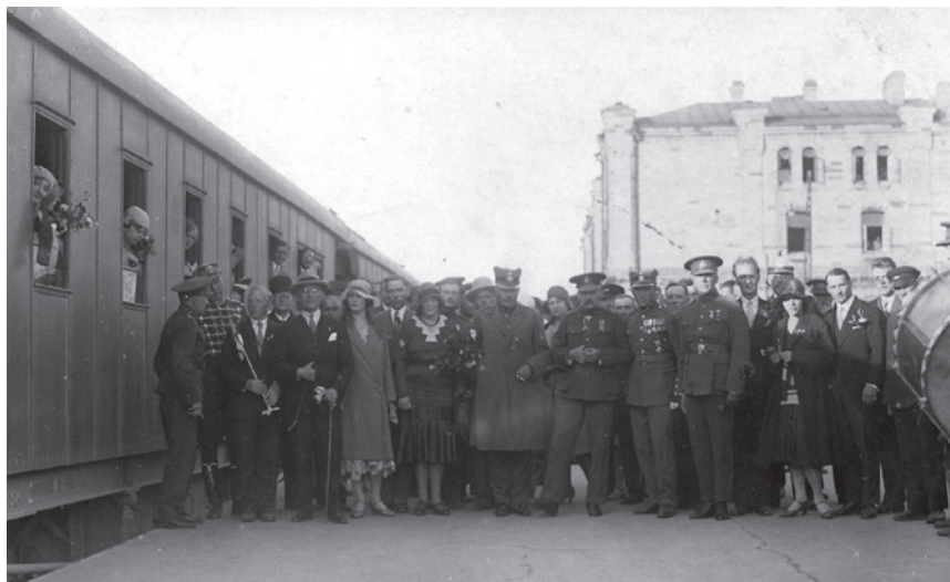
Landeswehri võitjad: kindralid Krišjānis Berķis (keskel vasakul) ja Ernst Põdder Tallinnas Balti jaamas (1920. aastate lõpp). Victors of Landeswehr: Generals Krišjānis Berķis (centre left) and Ernst Põdder in Tallinn at the Baltic Station (late 1920s).

ülemjuhataja kindral Dāvids Simansons oma Eesti kolleegi kindralmajor Johan Laidoneri saata abiks kas või üks soomusrong, sest olukord oli kriitiline.