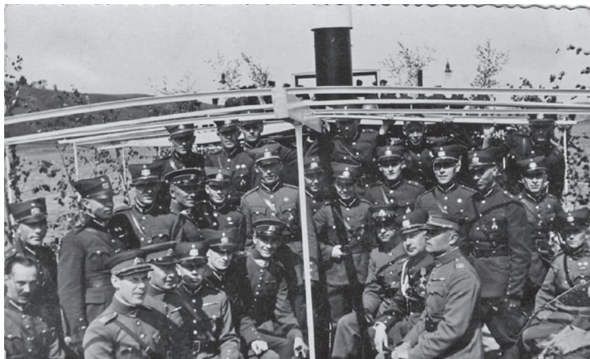
Leedu ja Läti ohvitserid ühisel väljasõidul (1930. aastate keskpaik).