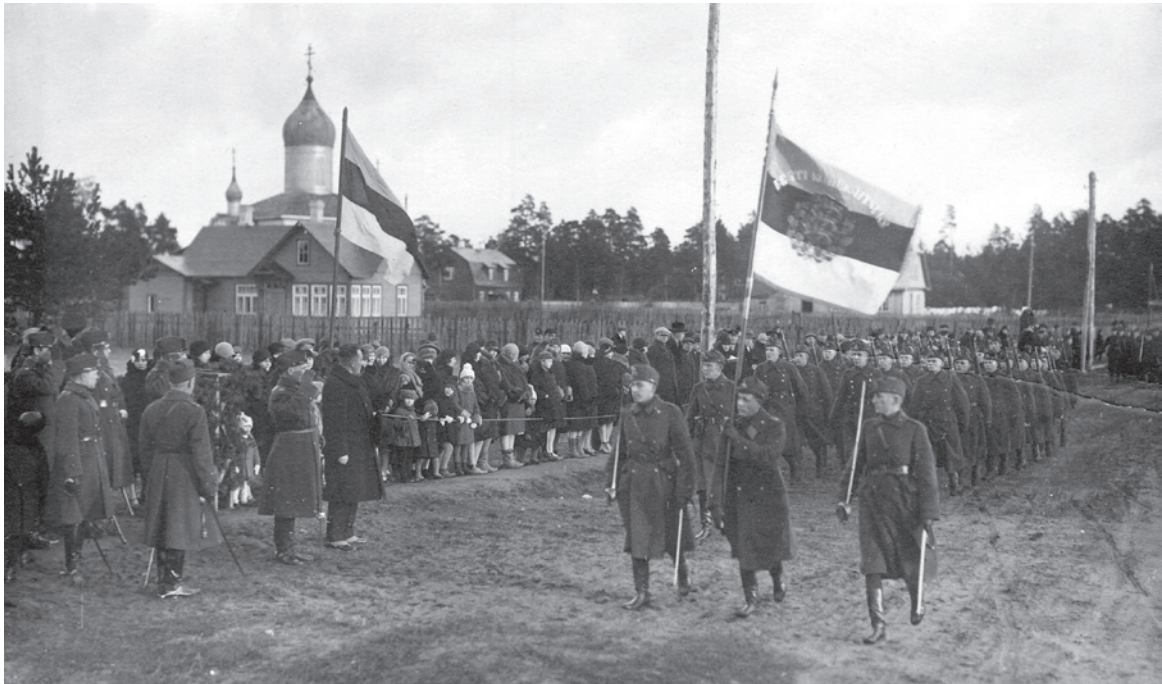
Pioneeripataljon möödamarsil. (Nõmme, 1929). Engineer battalion marching by (Nõmme, 1929).

amortiseerunud kasarmutes ja kitsastes ruumides, mis mõjus väljaõppele ja arengule üldse üsna pärssivalt. Polügoonid ja lasketiirud olid põhibaasist kaugel, koostöö teiste väeosadega puudulik. Ei jätkunud ei tehnikat ega varustust sõjaaja pioneeripataljonide komplekteerimiseks. 89