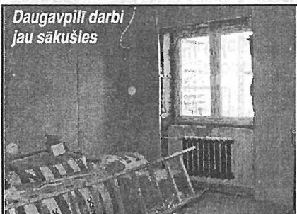
Daugavpili darbi jau sākušies

bi otrā stāva telpu atjaunošanai pēc ugunsgrēka pagājušā gadā. Pašlaik notiek skatuves demontāža, vienlaicīgi jaunās uzstādīšana. Sekos griestu, sienu, grīdas nomaiņa; krāsošanas darbi. Telpas jāsavied kārtībā līdz 20.aprīlim.