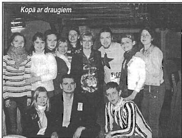
Kopā ar draugiem

Arī speciālisti no Lielbritānijas Dzirdes problēmu centra uzskata, ka šis gadījums ir ļoti neparasts. Tāpēc ka dzirdi zaudējušiem pacientiem turpmāk tomēr kā dziedniecības līdzeklis netiks ieteikta kalnu slēpošana. Info no interneta