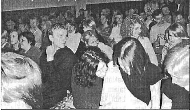
Skatītāju zāle bija pārpildīta...