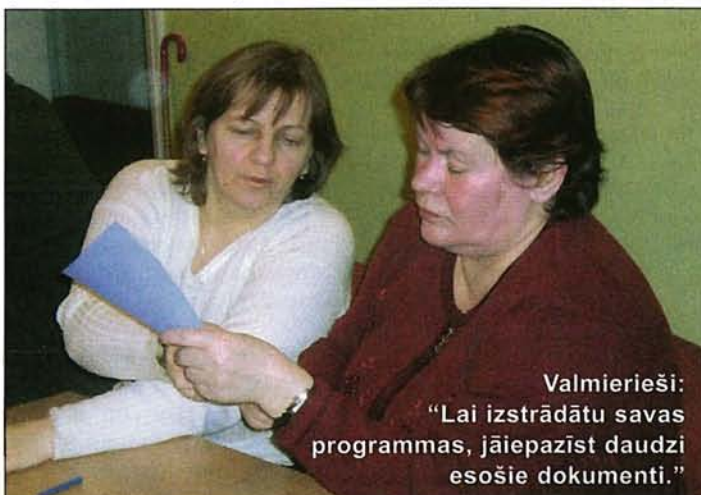
Valmierieši: “Lai izstrādātu savas programmas, jāiepazīst daudzi esošie dokumenti.”