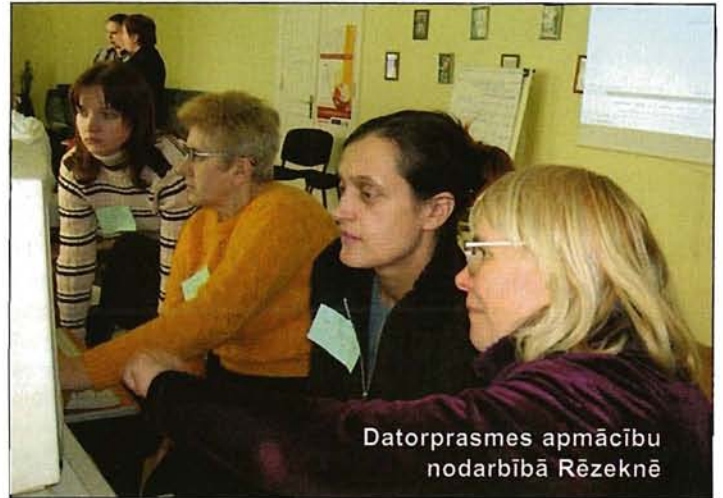
Datorprasmes apmācību nodarbībā Rēzeknē

Apmācība ilga 36 stundas, un tajā piedalījās sešas nedzirdīgās sievietes no dažādiem Latvijas novadiem, No 25 līdz 55 gadiem, dažāda sociālā statusa pārstāves – gan strādājošas, gan bezdarbnieces. Viņas nostiprināja un pilnveidoja pamatiemaņas darbā ar datora Windows Word, Internet Explorer programmu, kā arī iepazīs ar