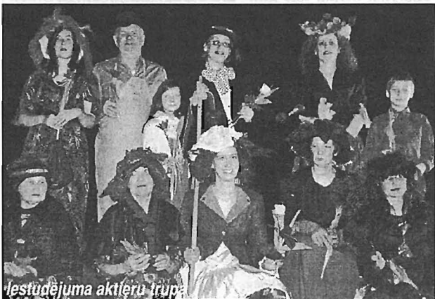
Iestudējuma aktieru grupa