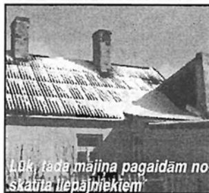
Lūk, tāda mājiņa pagaidām noskauda liepājniekiem

Dome apstiprināja valdes locekļu darba apmaksas kārtību, apstiprināja 2005.gada budžeta izpildi un izmaiņas 2006.gada budžetā, to palielinot par 42 tūkst. LVL (kopā — 558,4 tūkst. LVL).