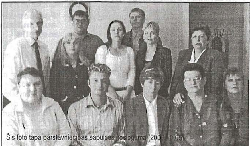
Šis foto tapa pārstāvniecības sapulces noslēgumā (2005.10.05)

Invalīdu un viņu draugu apvienība «Apeirons» izsaka vislielāko paldies LNS par godprātīgu projekta realizāciju un tiem rezultātiem, kas nākotnē tiešām spēs ietekmēt sociālo politiku.