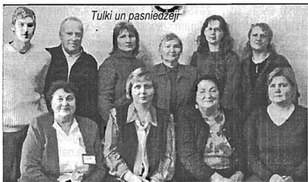
Tulki un pasniedzēji

Projekta mērķis bija veicināt latviešu zīmju valodas apguvi un lietošanu, pilnveidot latviešu nedzirdīgo zīmju valodu, veicināt vienotu zīmju lietošanu gan tul-