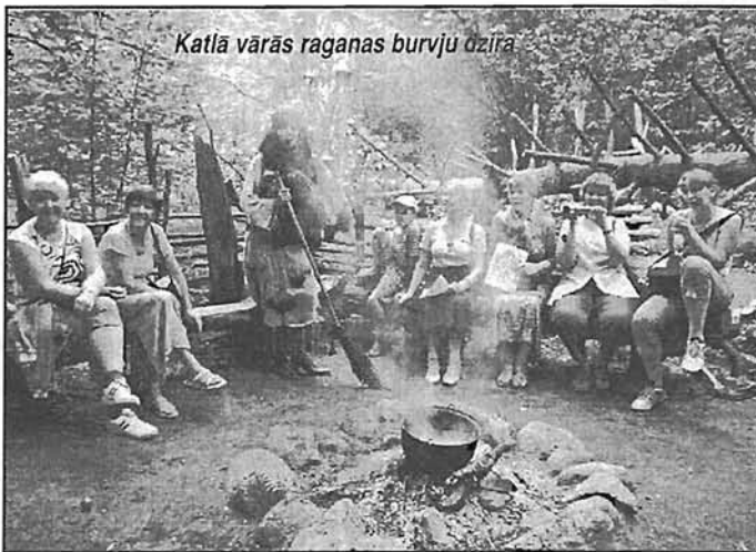
Katļā vārās raganas burvju ozīra

Šoreiz mūs pārsteidza pēkšņā Raganas parādīšanās un viņas daudzās izdarības ar visiem, kas patrāpījās ceļā.