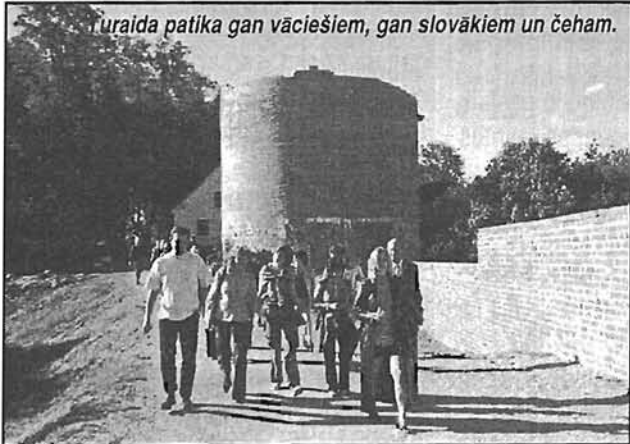
Turaida patika gan vāciešiem, gan slovākiem un čeham.

Vasaru sagaidām un aizvadām dažādi, bet ir viena raksturīga iezīme gandrīz visiem – tā ir tiekšanās laukā no četrām sienām, dabā, ūdeņu, mežu, zaļumu tuvumā.