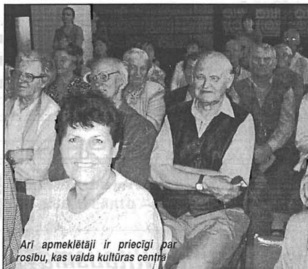
Arī apmeklētāji ir priecīgi par rosību, kas valda kultūras centrā

Un tomēr — jāatzīst, ka pats galvenais šī projekta uzdevums būs sasniegts: kultūras centrs būs sakārtots atbilstoši sociālo pakalpojumu sniedzējam izvirzītajiem noteikumiem attiecībā uz vides pieejamības nodrošināšanu visiem invalīdiem.»