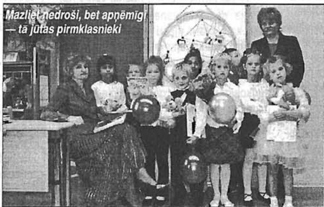
Mazliet nedroši, bet apņēmīgi – tā jūtas pirmklasnieki

Skolotāju kolektīvam un skolēniem svētku apsveikumu no Izglītības un zinātnes ministres Baibas Rivžas nolasiņa