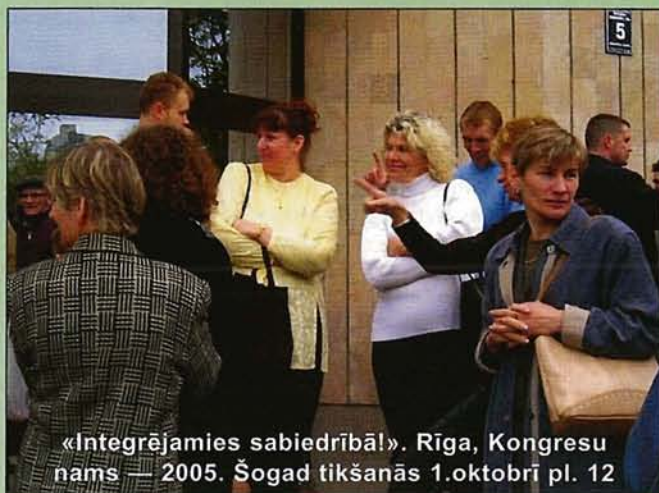
«Integrējamies sabiedrībā!». Rīga, Kongresu nams — 2005. Šogad tikšanās 1.oktobrī pl. 12

Uzdriktēšanās, drosme, neatlaidība, pašvērtības un pašcieņas stiprināšana — lūk, tās ir īpašības, kas katram sevi jāattīsta, lai rastu stabilu pamatu vispārējā konkurencē sabiedriskos procesos, darba tirgū, komunikācijā ar apkārtnējo sabiedrību mazākā (ģimene) vai lielākā (darba kolektīvā, interešu kopās, apvienībās utt.) mērogā. Tuvāk par projekta aktivitātēm — nākošajā ziņu lapā, bet šoreiz iepazīstinām jūs ar sievietēm, kurām šo īpašību netrūkst!