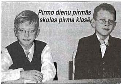
Pirmo dienu pirmās skolas pirmā klasē

Valmieras skolā arī notiek pamatīgi remontdarbi, kuri dažādu iemeslu