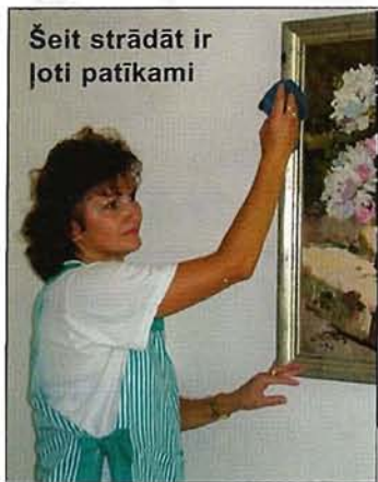
Šeit strādāt ir ļoti patīkami

⇒ Mācību laikā uzzinātais te labi noder, jo daudz kas jau pazīstams, nav vairs daudz jāprasa citiem. Visvairāk mēs uztraucamies, kā atbildēsim dzirdīgiem viesiem, ja mums kaut ko uzprasīs. Prakses vadītāja solīja padomāt, kā šo jautājumu atrisināt, — varbūt izgatavos parādāmu rakstveida ziņojumu: «Esmu nedzirdīga, lūdzu griezties reģistrācijā» vai tml.»