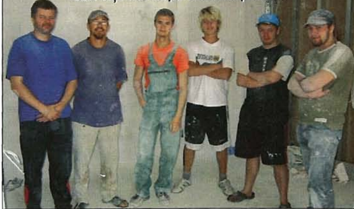
Šeit viņi visi kopā foto starpbrīdī...

Beidzu Rīgas 51.vidusskolu, turpinu mācīties Barkavas arodskolā. Arī agrāk kopā ar brāli veicu šādus darbus, tāpēc man tie nav sveši. Vēl ar tēti kopā strādāju Norvēģijā par krāsotāju — ik pa 3 mēnešiem kopā sanāca vesels gads. Tā bija liela pieredze. Tagad braucu gan mājās, gan palieku Siguldā. Vakaros arī gāja jautri — vasarā vairāk bija brīvā dabā iepazīnām pilsētu, tās skaisto apkārtni. Pa starpu vasaras sākumā pat ieskaites kārtoju. Visu var paspēt, ja grib!