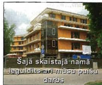
Šajā skaistajā namā ieguldīts arī mūsu puīšu darbs

Šī nebija pirmā vasara, kad strādāju kopā ar tēti. Tiesa, viņš ir stingrs, prasības pat lielākas nekā pret citiem, bet tas ir labi! Man tagad sākas īstā dzīve, jo skola pabeigta. Par tālākām mācībām vēl nedomāju. Vēl man