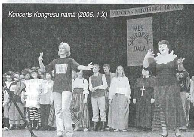
Koncerts Kongresu namā (2006. 1.X)