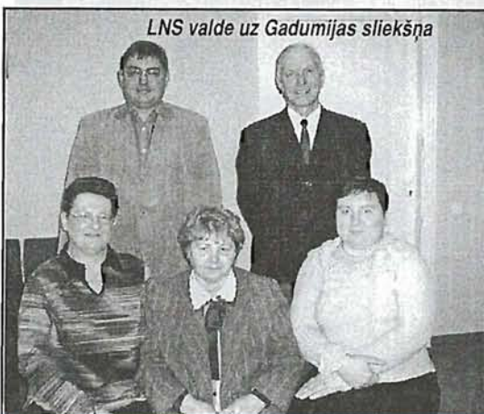
LNS valde uz Gadumijas sliekšņa

Mūsu valstī? Grūti teikt. Es tik dziļi esmu pats savos darbos, ka reti skatos apkārt. Manuprāt, nekas tik būtisks, ar ko 2006. gads paliks vēsturē Latvijā, nav noticis. Nu varbūt NATO samits. Bet arī tas drīz vien pagaisīs no atmi-