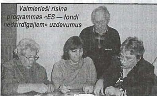
Valmierieši risina programmas «ES — fondi nedzirdīgajiem» uzdevumus

9., 16., 23., 30.I pl.13 Apskats «Pēdējās ziņas»; 20.I pl.12 Tematiska norise «Kopībā — saiets»