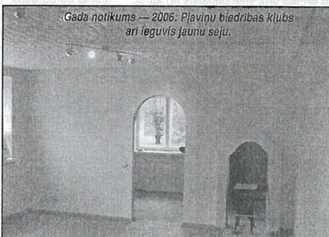
Gada notikums — 2006. Pļaviņu biedrības klubs arī ieguvis jaunu seju.