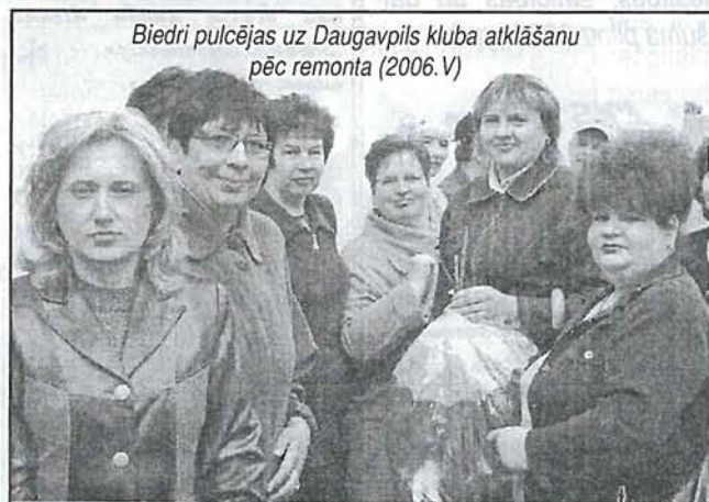
Biedri pulcējas uz Daugavpils kluba atklāšanu pēc remonta (2006.V)