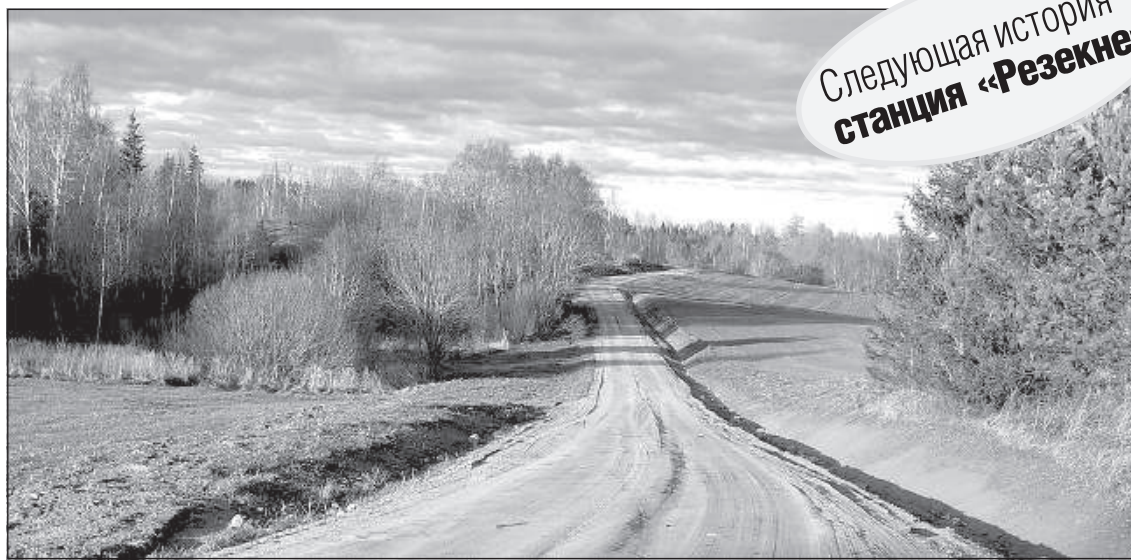
Дорога в Солошниеки.