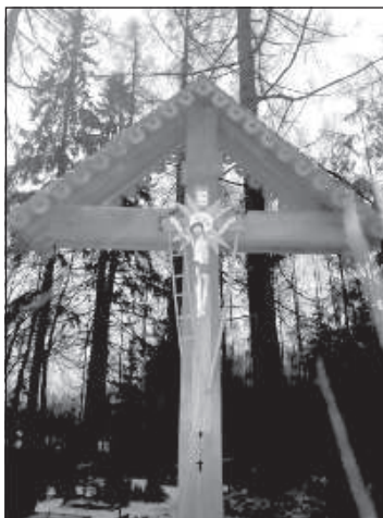
Центральный крест на Солошникском кладбище.