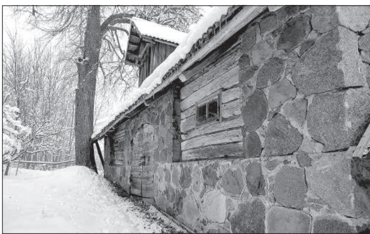
Так раньше строили.

лошников. Яниса Яунсудрабиньша привлек характер этой женщины и таланты – тоже литературные.