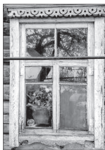
Традиционное латгальское окно.