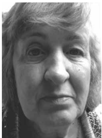
Pie ābeles baltās