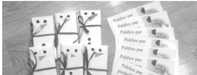
Konkursa dalībnieki saņēma pateicības rakstus un pārsteiguma balviņas.