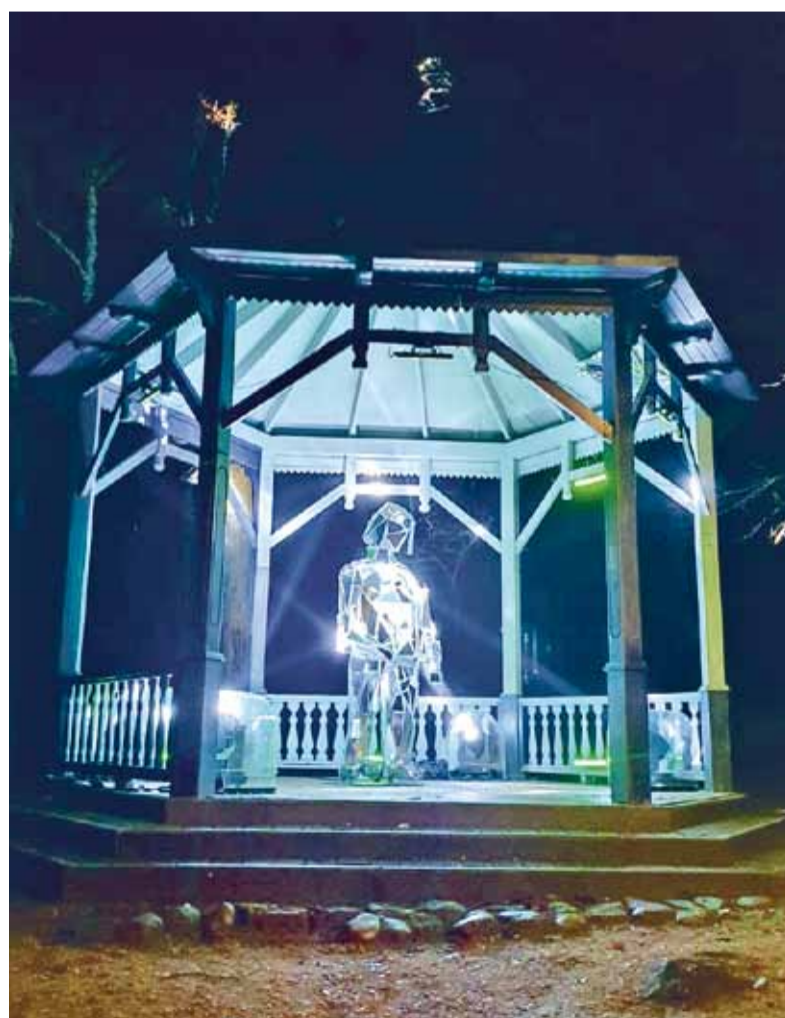
Tējas namiņā dažādās krāsu niansēs mirdzēja spoguļcilvēks.