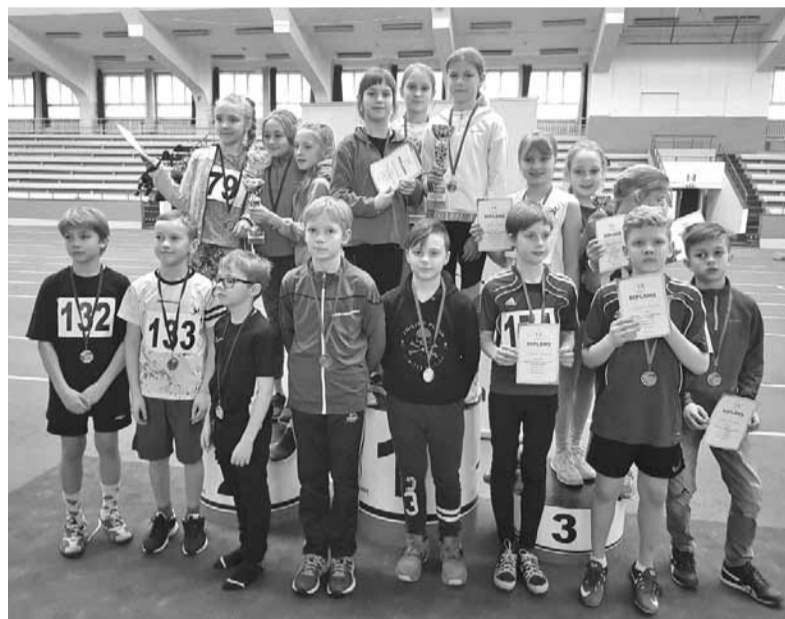
U12 vieglatlētu uzvara 6x160 jauktās stafetes skrējienā Rīgā.