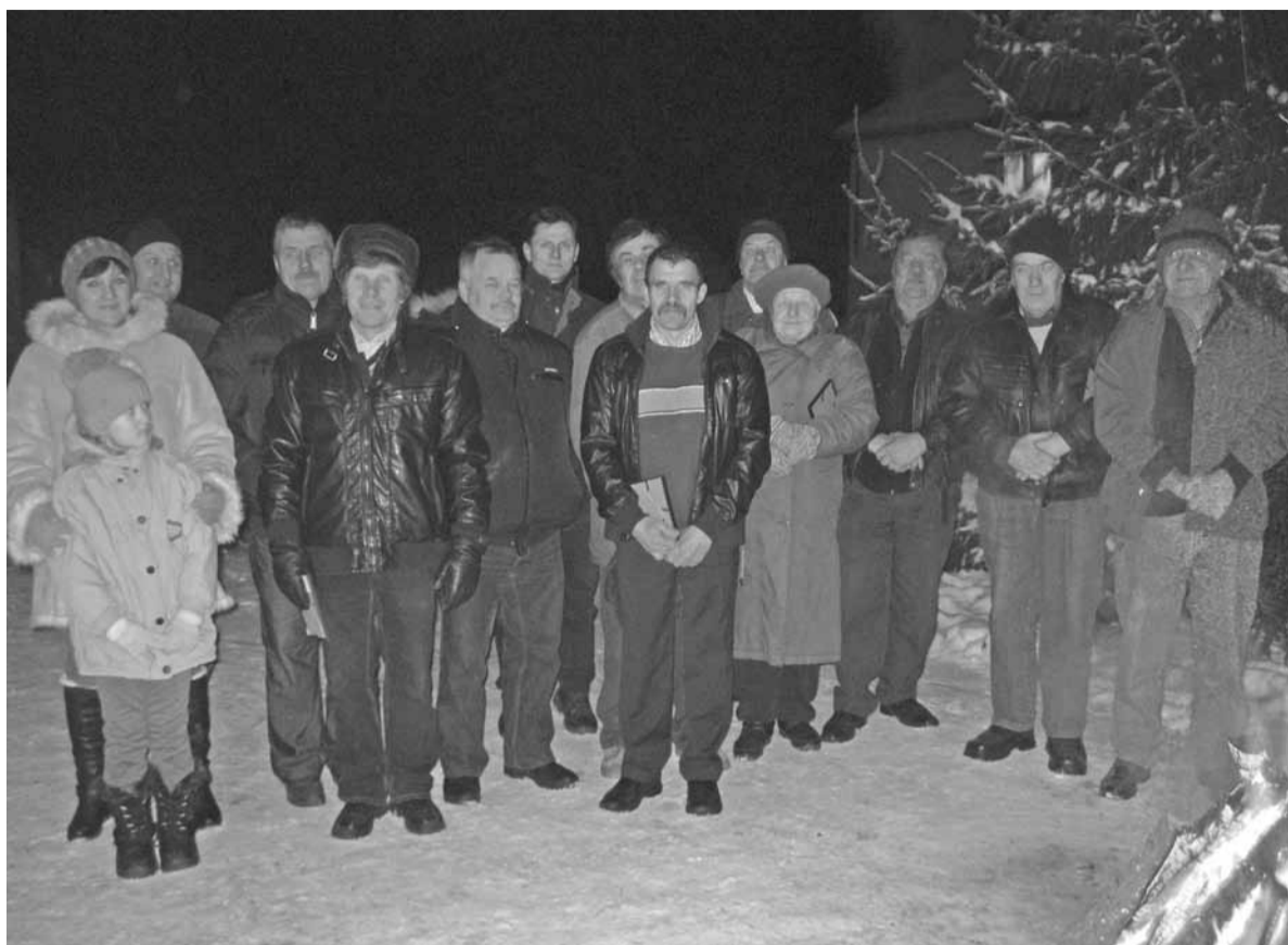
Iršu pagasta iedzīvotāji atceres pasākumā pie iedegta atmiņu uguns kura 2013. gada janvārī.