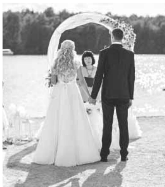
Mīlestības solījums vietā, kur pagātne sastopas ar nākotni.

Taču šis nav faktiskais mūžībā pavadīto Kokneses novada iedzīvotāju skaits, jo mirušo personu, tāpat kā jebkuru citu reģistrāciju, var reģistrēt jebkurā Latvijas dzimtsarakstu nodaļā. Miršanas reģistri sastādīti 37 Kokneses pagasta iedzīvotājiem: 16 vīriešiem un 21 sievietei; 9 Bebru pagasta iedzīvotājiem: 4 vīriešiem un 5 sievietēm; 8 Iršu pagasta iedzīvotājiem: 2 vīriešiem un 8 sievietēm. Divi mirušie reģistrēti, kuriem dzīvesvieta bijusi