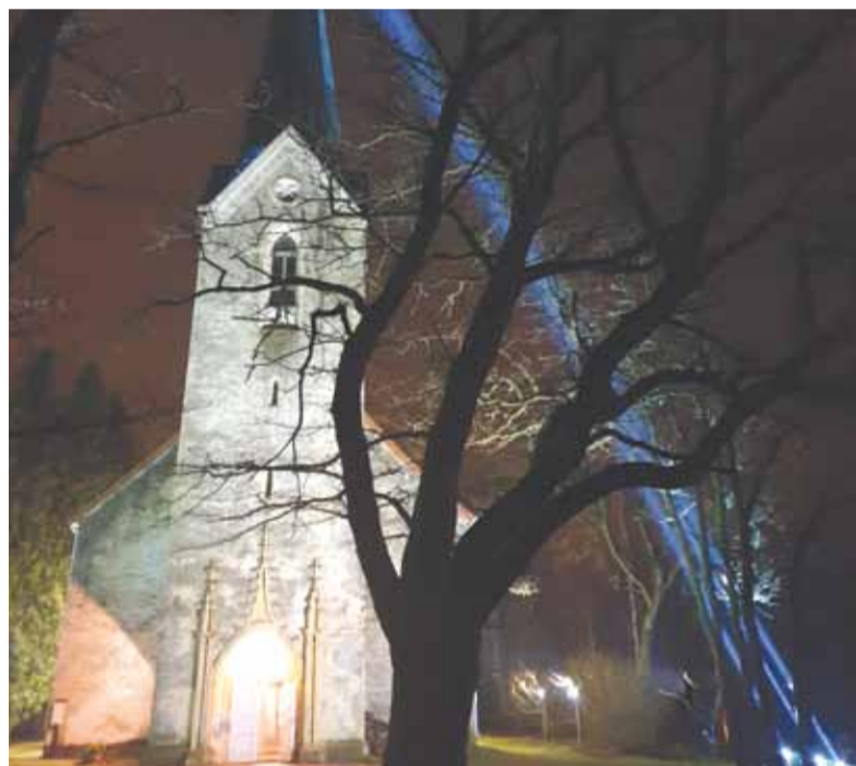
Dievnamu Daugavas krastā ieskāva gaismas ceļš, kas aizvijās debesīs.