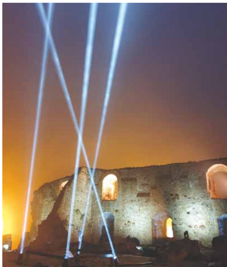
Kokneses viduslaiku pilsdrupās karsti pulsēja akmens sirds.