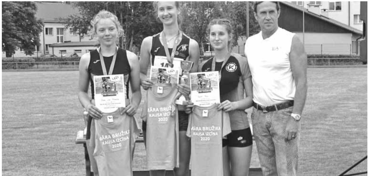
3.jūlijā Kokneses stadionā tika aizvadītas otrās Māra Bružika kausa izcīņas sacensības trīssoļlēcšanā desmit grupās, kopā piedaloties 47 trīssoļlēcējiem no visas Latvijas.

destāla pakāpiena, nodrošinot papildus punktus kopvērtējumam un kļūstot par Latvijas čempionu mini bagiju klasē.