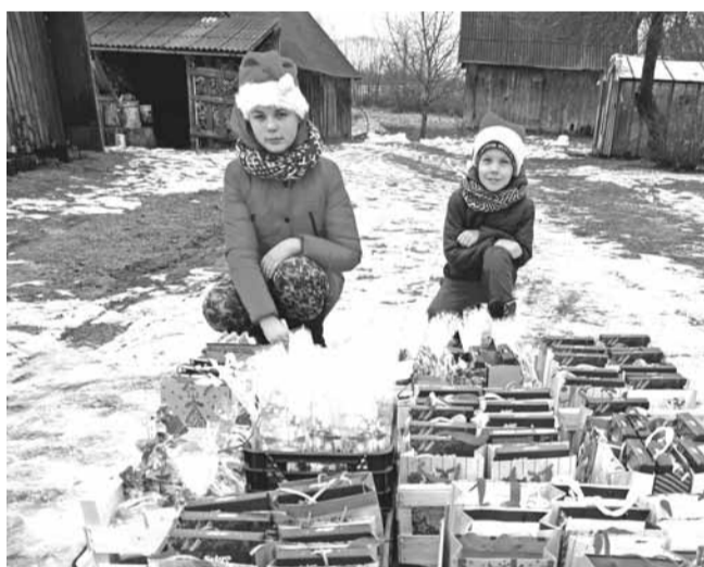
Paldies Riekstiņciema rūķiem par pārsteigumu Ziemassvētkos!

Lai skumjie brīži paskrien vēja spārniem, bet laimīgie - lai velkas mūžību! Lai gaisma ir prātos, sirdīs un darbos! Lai mums visiem burvīgs jaunais gads!