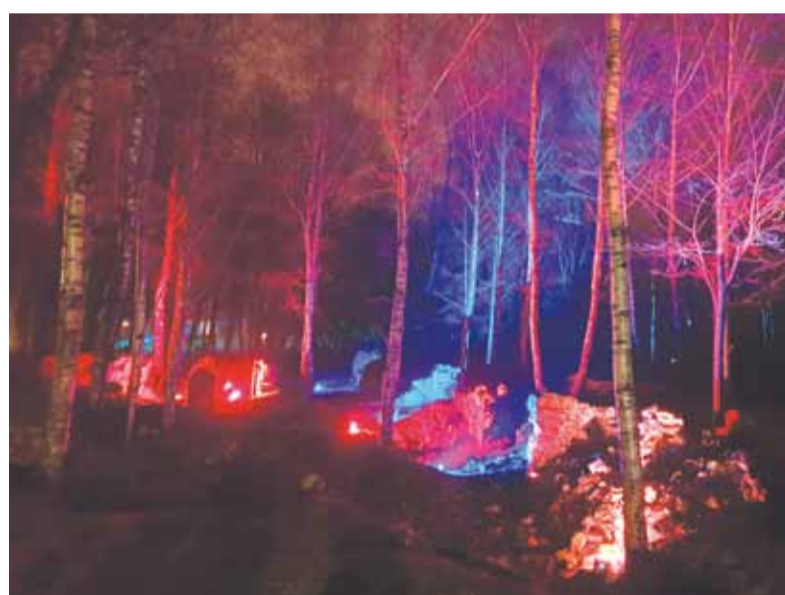
Gar Jaunās pils drupām kā ziemas pasakā zībsnija maldugunis.