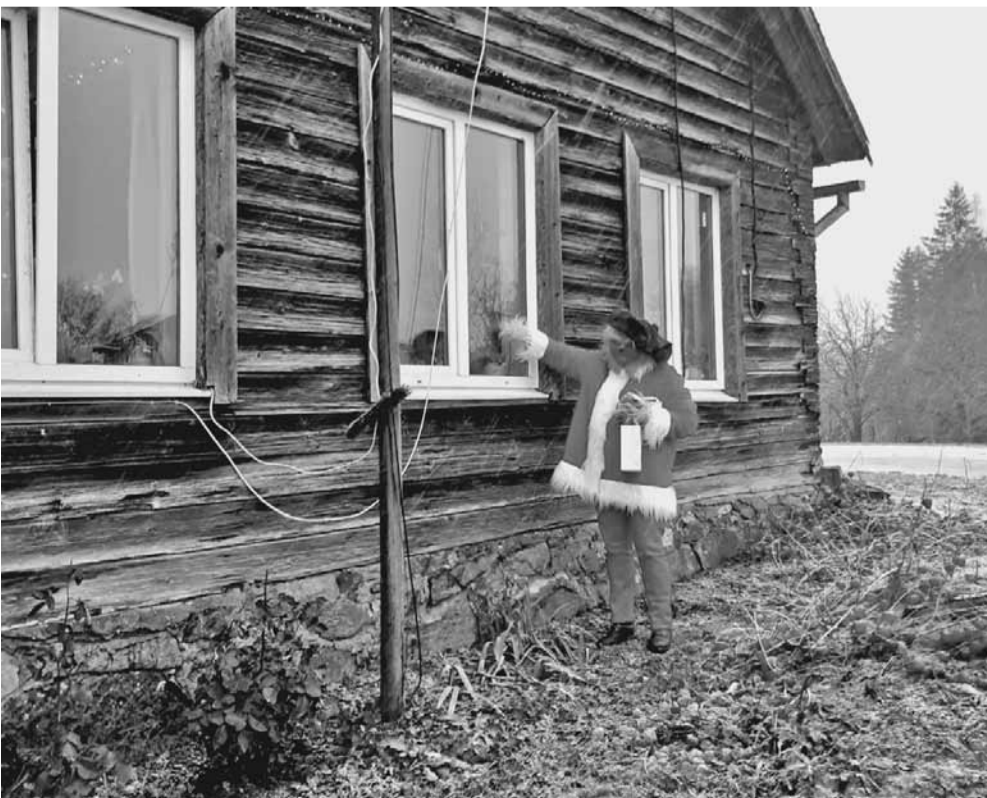
Mūsu pusē manītais Grinčs nenozaga Ziemassvētkus, gluži otrādi – nesa svētku prieku!