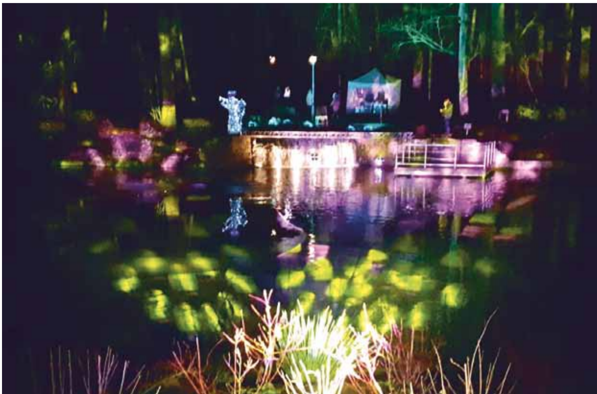
Tik krāšņs un noslēpumains vizēja Pērses ūdenskrituma atveids.