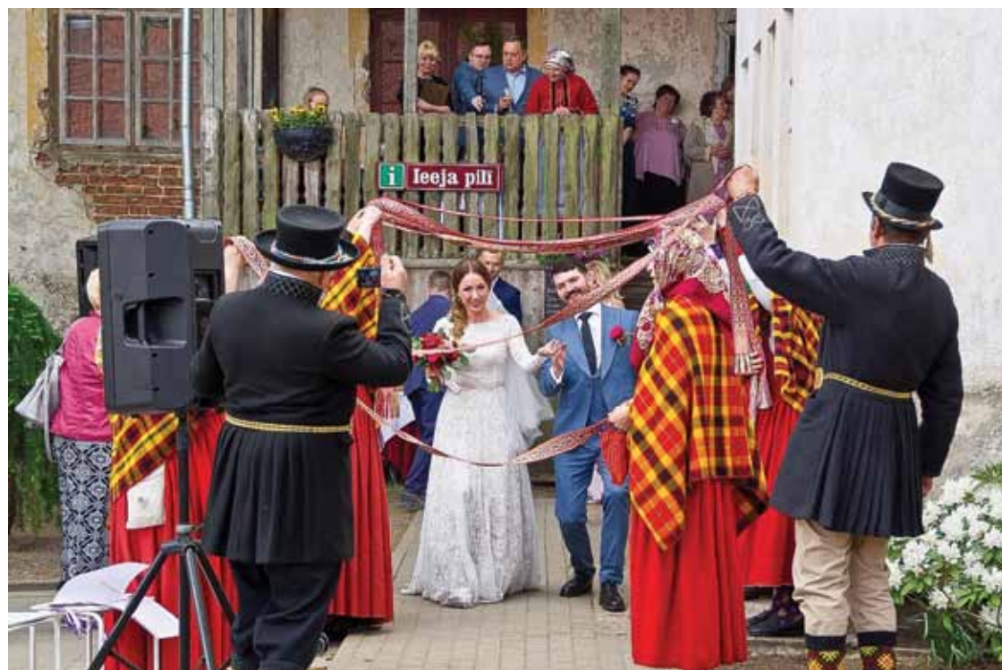
Rīdzinieku pāris ar suitu saknēm pagājušajā gadā laulājies Alsungā. Pārsteigumu pēc tam sagādājuši etnogrāfiskie ansambļi Suitu vīri un Suitu sievas un arī Suitu muzikanti .

Diemžēl nav precīzu ziņu, kur tieši tā atradusies sākotnēji, bet savulaik laulības notikušas Liepājas ielā 14, pēc tam no 1968. gada – Kuldīgas rajona izpildkomitejā īpaši dzimtsarakstu birojā iekārtotā laulību zālē. Kopš 1994. gada tās notiek Kuldīgas jaunā rātsnoma jeb tagad domes lielajā zālē.