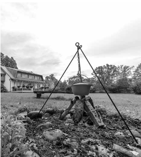
Pērnvasar bizness esot vedies gana labi, bet pēdējā laikā pieprasījums bijis arī ziemā.