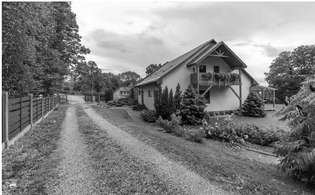
Viesu namam Dzintara pirts Vilgālē vasara ir aktīvākais periods, taču kā būs šogad? Kovida ierobežojumu dēļ ir daudz neskaidrību.

Dzintara pirti tāpat kā jebkuru viesmīlības uzņēmumu jau gadu