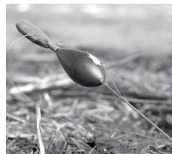
Cilvēks dabā atstāj teju jebko: sākot ar tukšām dzērienu pudelēm un beidzot ar makšķerēšanas piederumu pārpalikumiem.