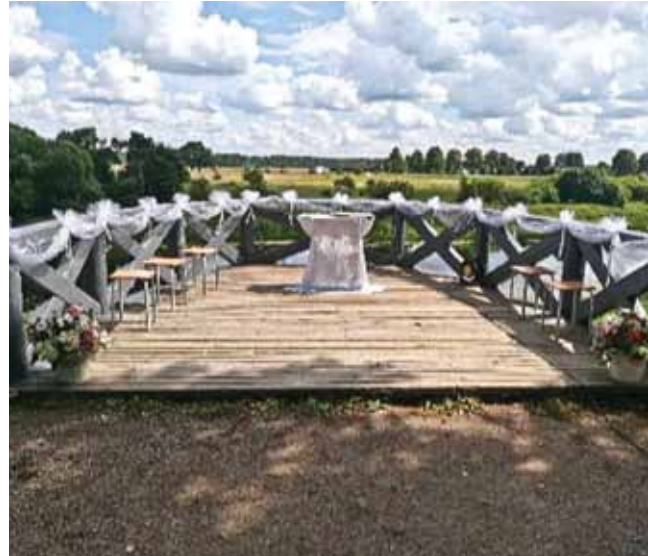
Skrundā daudzi pāri par kāzu vietu izragās skatu laukumiņu pie Ventas.

Eva, Kate, Alise, Elizabete. Neierastāki vārdi ir Gerharts, Braiss, Eliots, Noa, Nate, Leila, Jasmina, aizvadītajā gadā bija meitenītes Heilija, Millija, Otilija.”