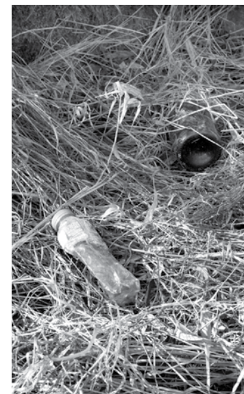
Pavasari atklājas tie atkritumi, ko cilvēks zālē iemetis jau rudenī. Uzsnīga sniegs, un tie pazuda. Sniegs nokusa, un tie kļuva redzami.