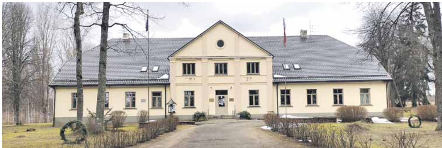
No 8. līdz 17. martam Kuldīgas novadā ar jauno koronavīrusu saslimuši vēl 63 cilvēki. Tā liecina ziņas portālā Data.gov.lv . Tas skāris arī Snēpeli, tāpēc šī pagasta pārvalde līdz 25. martam slēgta.

Covid-19 uzliesmojumu Gudenieku pusē apstiprina pārvaldes