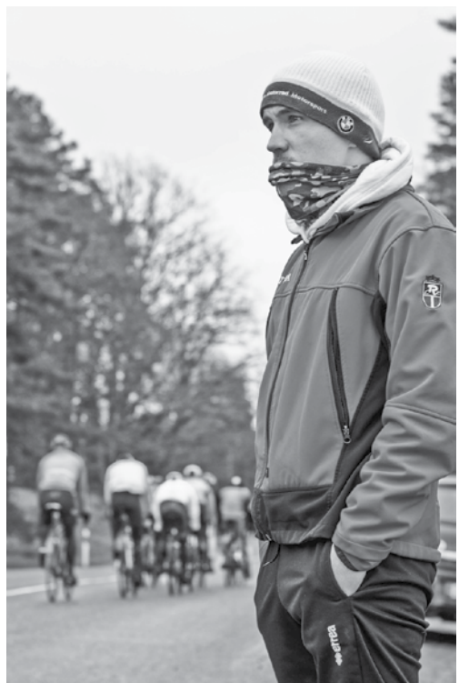
Vērojot braucējus treniņā.

Tā ir – plāns ir veidot komandu, kas piedalīsies Latvijas kausa izcīņā. Iesaistīsim B un A grupas sporta skolas audzēkņus. Kad būs iespēja, piedalīsimies arī sacensībās Lietuvā, Igaunijā. Plāni mums lieli. Vēlamies klubu attīstīt augstā līmenī, kļūt arī par vienu no labākajām Latvijas jauniešu un junioru ko-