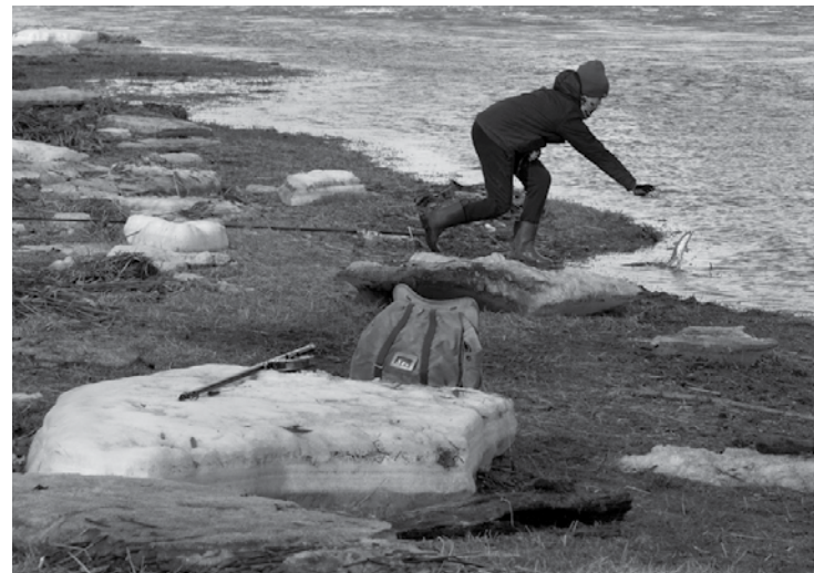
Ir sena indiāņu paruna, ka dabu mēs esam nevis mantojuši no senčiem, bet gan aizņēmušies no bērniem. Kādu mēs to viņiem atstāsim?

Arī ar atkritumu urnām Ventmalā ir problēmas. Piemēram, pie Melnās kolkas tās ir, bet kafijas krūzes, dzērienu pudeles bieži vien nomestas pa krauju. Kurš tās, pa nogāzi rāpojot, lasa? Komunālā dienesta darbinieki. Tamdēļ jaunu urnu ierīkošana nebūs efektīva – Dz.Strazda uzskata, ka vajadzīga intensīva sabiedrības informēšana un audzināšana. Tagad populārākajās atpūtas vietās tiek izlikti plakāti ar aicinājumu: „Ko atnesi, to aiznes!”