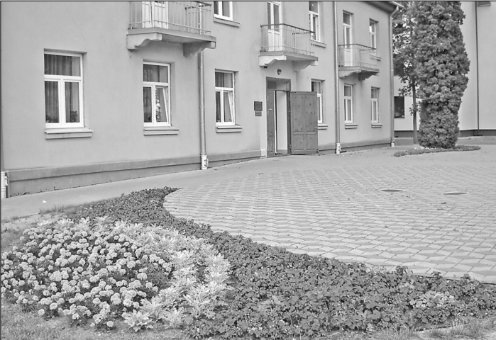
Apstādījumi pilsētas sabiedriskajās teritorijās ir spilgts un košs vasaras akcents.