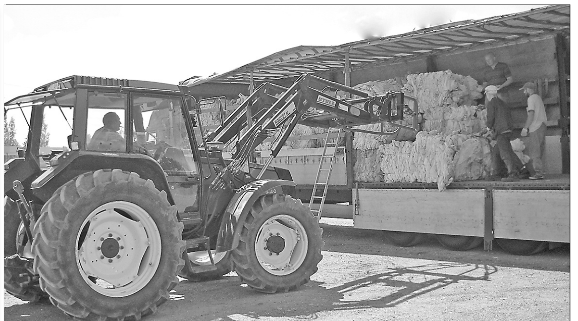
Attēlā – smagās plēvju ķīpas ar traktoru tiek iekrautas kravas mašīnā, kas tās aizvedīs otrreizējai pārstrādei.

Polietilēna (PE) jeb plēves iepakojums tiek iedalīts divās lielās grupās. Pirmajā grupā ietilpst LDPE (low density polyethylene) – zema blīvuma polietilēns. Šajā iepakojuma veidā tiek iekļauta biežā (nečaukstoša) iepakojuma plēve, termoplēve, «Strech» plēve, kas ir plāna, caurspīdīga un staipīga, visbiežāk šo plēvi tin apkārt preču transportēšanas paletēm, dažādas kanniņas un iepakojuma pudeles. Otrajā grupā ietilpst HDPE (high density polyethylene) – augsta blīvuma polietilēns. Šajā iepakojuma veidā galvenokārt ietilpst pudeļu taras kastes, mucas un kannas, dažādu tilpumu plastmasas pudeles. Jāpiebilst, ka SIA «Preiļu saimnieks» Atkritumu šķirošanas laukumā otrreizējai pārstrādei tiek sagatavoti visi minētie plēves veidi.