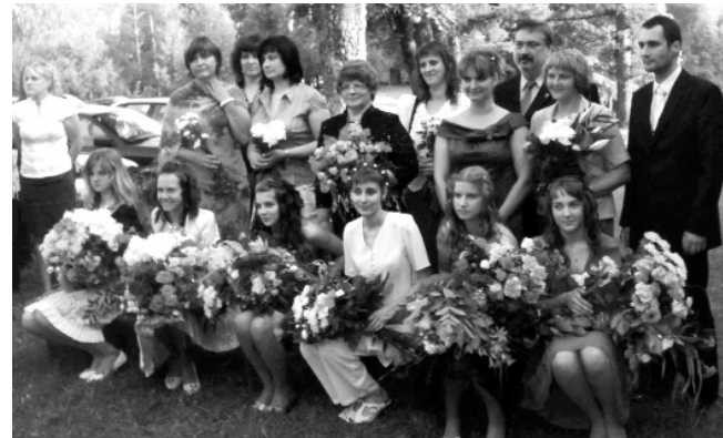
Ozolu pamatskolas 9.klases absolventu izlaidums Mierkalna tautas namā.

Mūsu mazajai saimei ir liels prieks par to, ka varam strādāt skaisti izremontētā skolā – ir ielikti jauni logi un durvis, skolai uzlikts jauns jumts, beidzot ir sakārtots arī sanitārais mezgls. Vēl turpinās darbi skolas ārpusē.