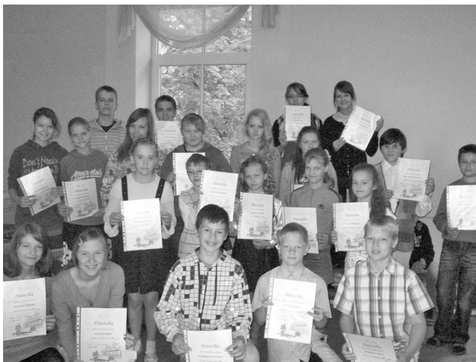
Mācību gada noslēguma Pateicības saņēmējie Vijciema pamatskolas skolēni.