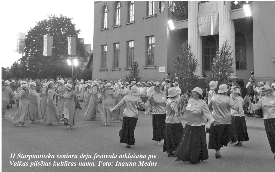
II Starptautiskā senioru deju festivāla atklāšana pie Valkas pilsētas kultūras nama.

Ir pagājuši 3 gadi un atkal Valkas pilsēta un novads pulcē kopā dejojotājus – seniorus no visas Latvijas – Cēsu, Beverīnas, Alojās, Valmieras, Gulbenes, Alūksnes, Jelgavas, Ogres, Siguldas, Rīgas, Rundāles, Balvu, Vārkavas un Saldus novadiem.