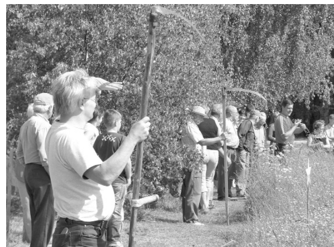
Starts pirmajām pļaušanas sacensībām Kārķos, kas notika 2009. gada 22. jūnijā.

„Pulksten 11.30 sāksies dalībnieku reģistrācija un pļaušanas laukuma izloze, pulksten 12.00 – sacensību atklāšana. Aicināti piedalīties visi, kuri prot pļaut ar rokas izkapti. Dalībnieki startēs pa vecuma grupām: jaunieši līdz 21.gada vecumam, jaunieši līdz 21.gada vecumam, vīrieši no 21.gada vecuma un sievietes no 21.gada vecuma. Sacensībās katrs dalībnieks piedalās ar savu izkapti. Dalībnieku un skatītāju drošībai, dodoties uz sacensību vietu un no sacensībām, izkaptis asmenim obligāti jābūt aptītam. Sacensību norises gaitu nosaka nolikums. Tajā noteikts, ka pļaujama platība ir 5 x 5 m. Dalībnieki pēc signāla sāk pļaut lauku no kreisā priekšējā stūra. Laika uzskaiti pārtrauks brīdī, kad pļāvējs būs nopļāvis lauku un uzslējis izkapti stāvus. Izvērtējot pļaušanas rezultātu, tiks ņemti vērā vairāki vērtējumi – pļaušanas ātrums, ko ar hronometru fiksēs tiesnesis, vāla taisnums un pļāvuma gludums. Sacensības vērtēs iepriekš izveidota kompetenta komisija,” stāsta sacensību organizētāja, tautas nama vadītāja Dace Pieče. Pieteikties sacensībām var pa tāl-