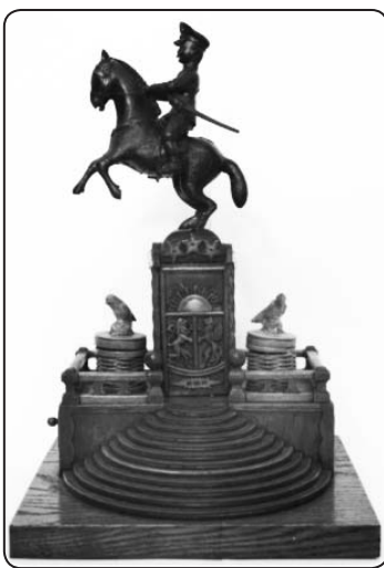
O.Vītiņa veidotais pieminēkla makets

Pagājušajā gadā muzejā bija iekārtota Alda Māra Dubļāna fotogrāfiju izstāde «...pirms 20 gadiem», veltīta Latvijas PSR Augstākās Padomes Deklarācijas «Par Latvijas Republikas neatkarības atjau-