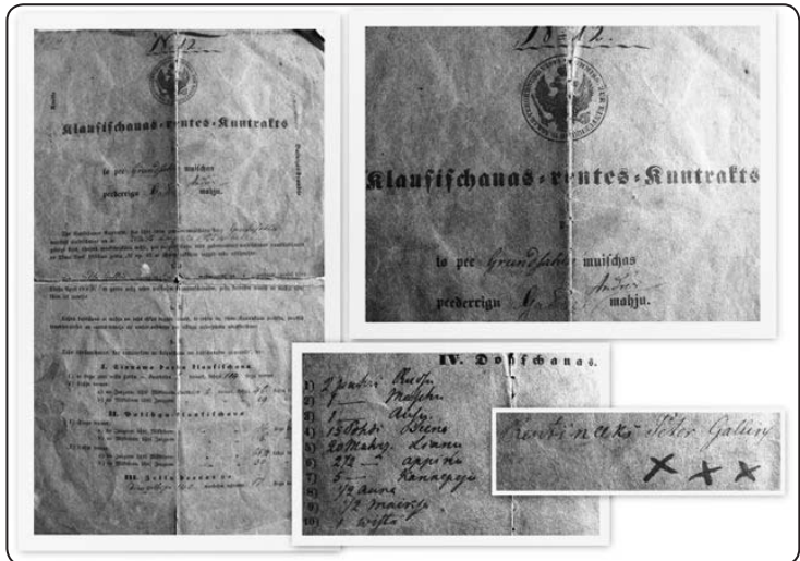
Grundzāles pagasta «Gaides» māju un zemes klaušu un naudas rentes kontrakti