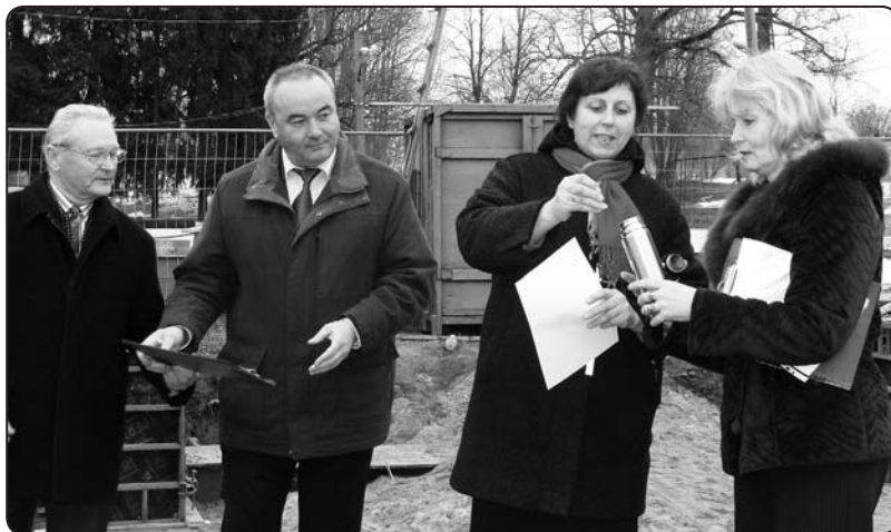
6.aprīlī Vijciemā, piedaloties LR Izglītības un zinātnes ministram Rolands Brokam un Zemkopības ministram Jānim Dūklavam, novada domes vadībai, ceļniekiem, skolēniem, vietējiem iedzīvotājiem un vēl citiem interesentiem, svinīgā pasākumā tika iemūrēts sporta zāles pamatakmens ar kapsulu, kurā ielikts vēstījums nākošajam paaudzēm.

Vislatvijas Lielā Talka ir jau tradicionāls un labi organizēts kopīgs pasākums. Talkas ideju atbalsta arī Valkas novada dome un aicina ikvienu, kuram rūp sakopta vide, piedalīties kopīgos darbos 30.aprīlī no plkst.9.00 – 15.00. Valkas pilsētā, Valkas, Ērgemes, Vijciema un Zvārtavas pagastā. Kārķu pagastā talka notiks 29.aprīlī Meža dienās, kuru laikā tiks stādīti koki un kopta vide.