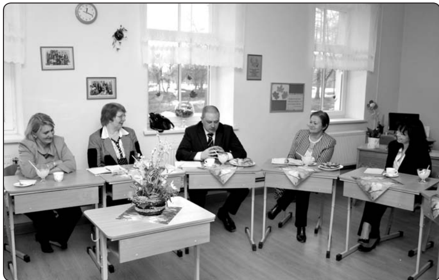
Tikšanās reizē diskutējām par naudas sadales principu «nauda seko skolēnam».

Valkas novada Izglītības pārvaldes vadītāja