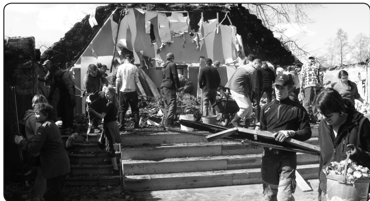
Nodegušā Vijciema tautas nama sakopšanas talkā katrs cenšas palīdzēt kā var un prot