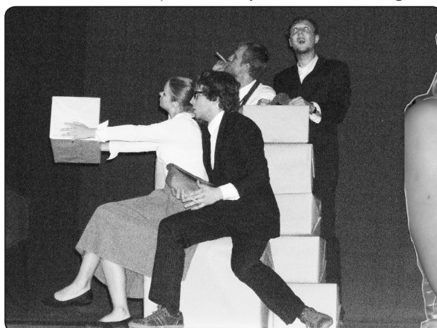
Viļņas teātra izrāde «Profesora sievas liktenis»