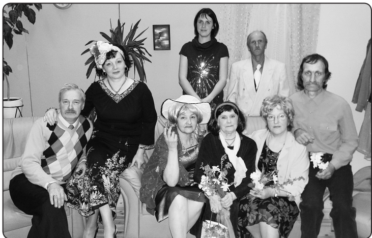
Kārķu amatiereteātra kolektīvs pēc skatītāju vēlēšanās Pagasta dienās aicina uz izrādi «Trīs košas dāmas»

12.un 13.augustā Kārķu pagasta pārvalde sadarbībā ar skolu, tautas namu un jauniešu centru organizē pagasta svētkus, kas jau tradicionāli katru gadu notiek augusta sākumā.