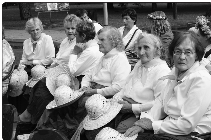
Kārķu senioru deju kopa «Vēl dziedam» prot uzplaukt un uzdziedēt jebkurā gadalaikā