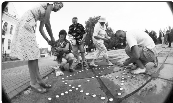
Katra pagasta izvēlētais latvju raksts atgādina par tautas vērtībām