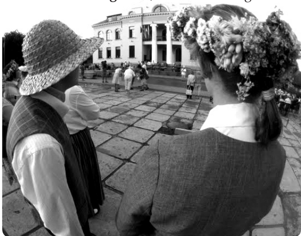
Skats no mals uz novada kultūru un kultūras namu