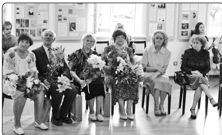
Novada Dižlaužu titulu nav iespējams iegūt, to var tikai nopelnīt ar ļaužu mīlestību un cieņu