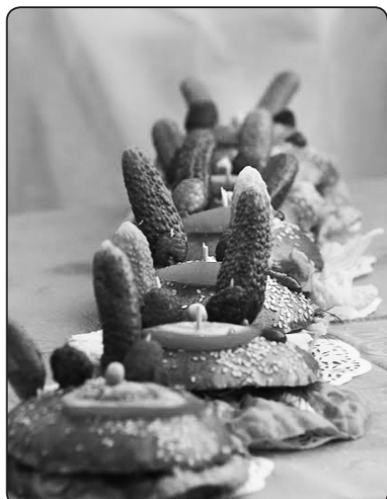
Ēst vai neēst – tāds ir jautājums