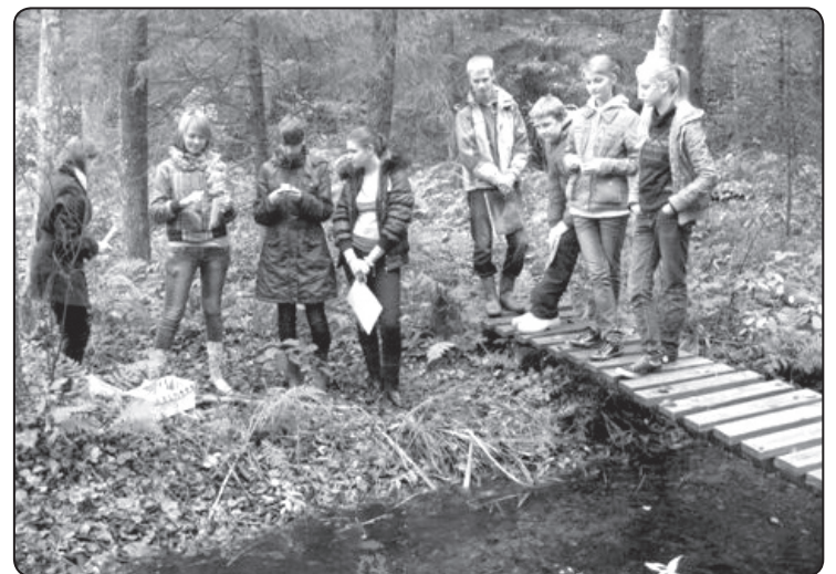
Skolēni iepazīstas ar dabas daudzveidību Kokšu ezeru apkārtnē

Valkas novada Izglītības pārvaldes vadītāja Dzintra Auzāne