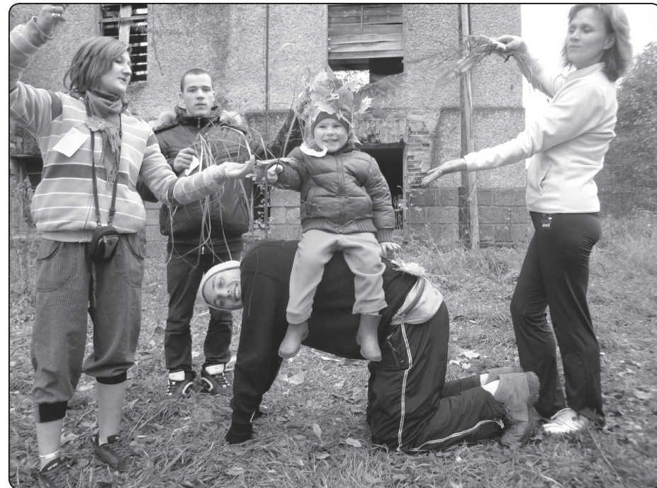
Komanda karaļa godā ieceļ pašu mazāko dalībnieku

draugus. Joprojām turpinu starot par tikko izbaudīto jauko un rudenīgo nedēļas nogali kopā ar namiņa ģipariem. Pēc tādām aktivitātēm aizvien vairāk un vairāk gribās darīt kaut ko labu, pozitīvu, vērtīgu un iedvesmojošu, jo dzīve mums tik viena dota un gribas to pavadīt godam jeb manā gadījumā sagādājot prieku citiem, darot to, ko mīlu, dzīvojot dzīvi nevis izdzīvojot... Protams, gribēju visiem, kas piedalījās vai kā savādāk palīdzēja īstenot šo ideju, no sirds pateikties, jo bez jums tas nebūtu