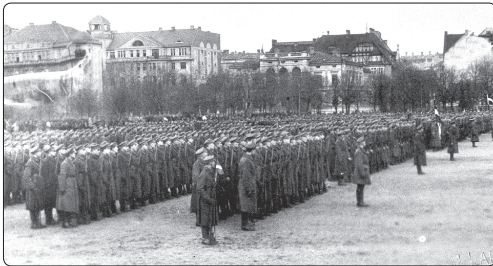
Latvijas armijas parāde Rīgā, Esplanādē, 1920.gada 11.novembris

Pirmajā apbalvošanas reizē, 1920.gada 13.augustā piešķīra septiņus Lāčplēša Kara ordeņus. Ordeni ar 1.numuru saņēma ģenerālis Pēteris Radziņš – viena no izcilākajām mūsu novada personībām. P.Radziņš dzimis 1880.gada 2.maijā Lugažu (tagad Valkas) pagasta «Jaunvīndzedzēs». Jau 1898.gadā Pēteris Radziņš kā brīvprātīgais iestājās krievu armijā, kur dienēja līdz pat 1919.gada rudenim, kad atgriezās Latvijā. Drīz pēc atgriešanās, viņu iecēla par Armijas virspavēlnieka štāba priekšnieku. Kā