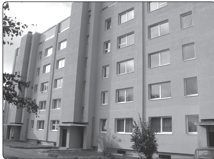
Novadā pirmā renovētā māja ir labs paraugs, uz kuru tiekies

Vienkāršotās renovācijas darbu ietvaros ir veikta ēkas āršienunpagrabapārsegumu