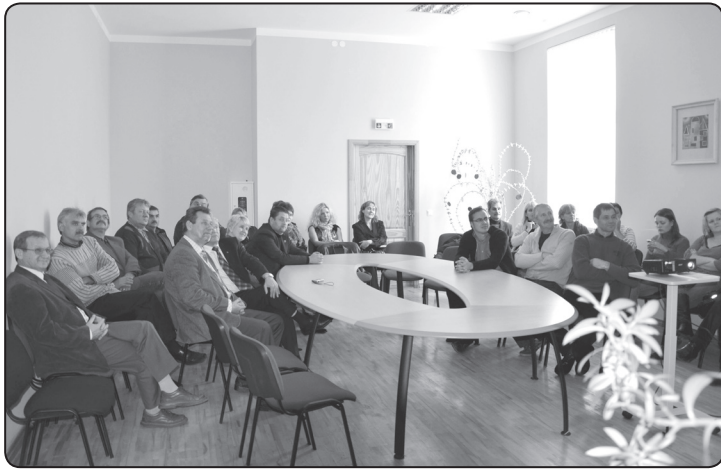
Aizputes domē Valkas novada speciālisti gūst jaunas atziņas darbam

Pieredzes apmaiņas vizītes laikā tikāmies ar Aizputes vidusskolas direktori un skolotājiem, kuri iepazīstināja ar Eiropas Reģionālās attīstības fonda (ERAF) projekta palīdzību sasniegtajiem rezultātiem skolā: