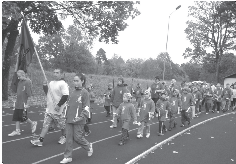
Ērgemieši svētku parādē, nesot skolas karogu, var būt lepnī par sportisko komandu

Savukārt, 1., 2.klases skolēni kopā ar audzinātājam mācēja apvienot lietderīgo ar patīkamo un pēc rīta rosmes stadionā devās uz Valkas novadpētniecības muzeju. Tajā bērni iepazīs ar izvietoto ekspozīciju, kurā bija apskatāmi dažādi mūzikas instrumenti, vecā nauda, grāmatas. Interesanta bija darbošanās senajā skolas telpā, sēdēt tā laika skolas solā un