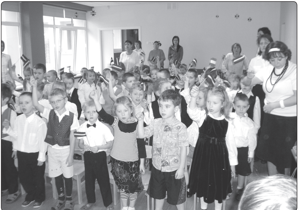
Gatavojoties svētkiem, bērni mācās Latvijas himnu un izzina Valsts karoga vēsturi