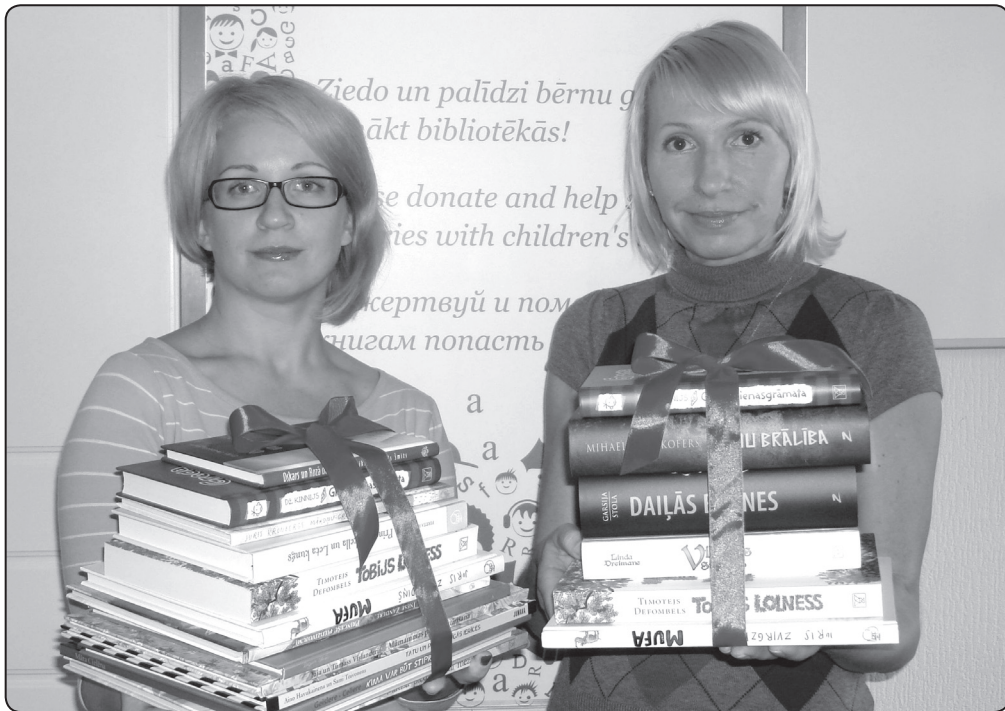
Projekta organizatori cer, ka grāmatas priecēs ikvienu lasītāju