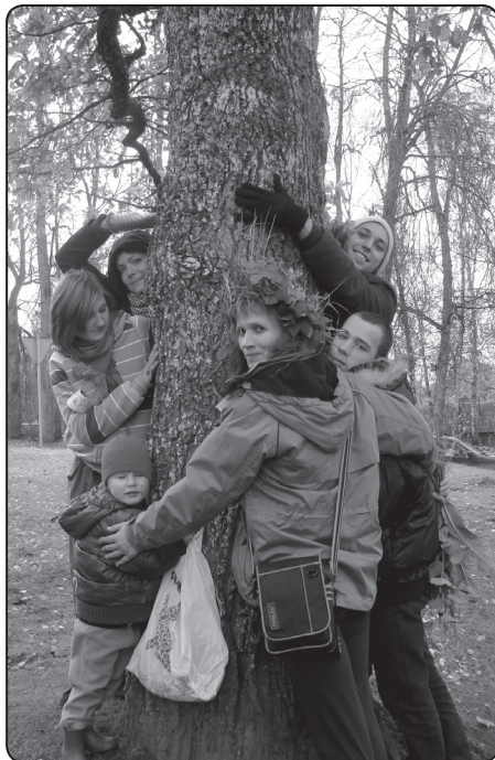
Pārgājiens dalībnieki atrod un samīļo K.Ulmaņa stādīto ozolu