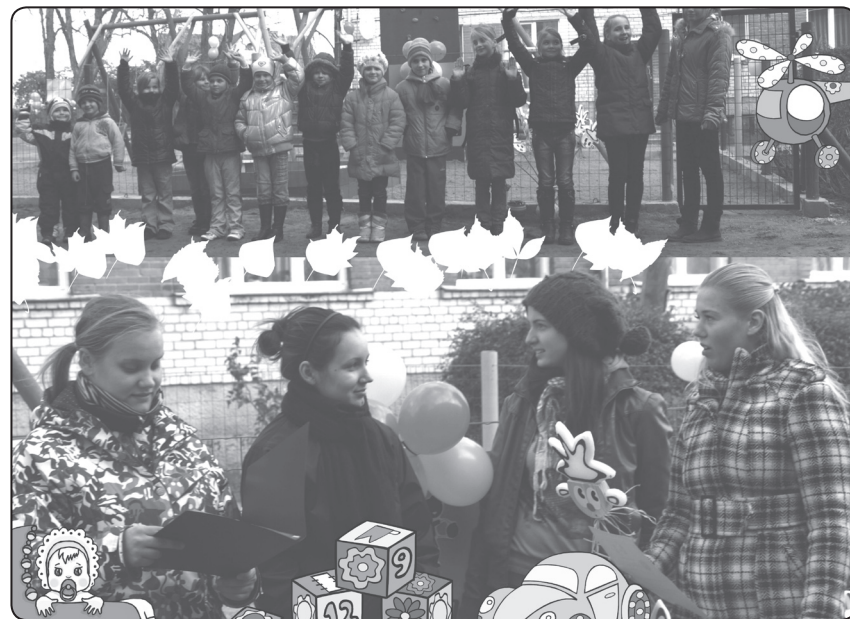
Rotaļlaukuma atklāšana ir priecīgs brīdis Sēļu ciema iedzīvotājiem un viesiem